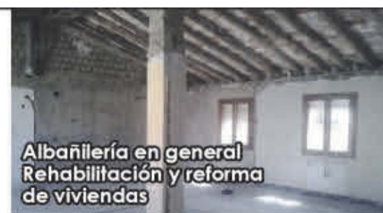
Albañilería en general Rehabilitación y reforma de viviendas