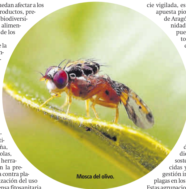
Mosca del olivo.

En estos momentos se está a la espera de que se apruebe la modificación del PEPAC, por parte de la UE, para incluir en esta subvención el apoyo a la implantación de proyectos demostrativos de métodos biotecnológicos para el control de plagas que precisen la cooperación entre agrupaciones de agricultores. Concretamente, la aplicación de confusión sexual para la lucha contra Lobesia botrana en viña y la captura masiva o atracción y muerte de adultos de Bactrocera oleae en olivar. ■