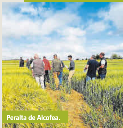
Peralta de Alcofea.