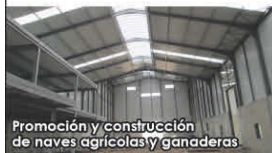
Promoción y construcción de naves agrícolas y ganaderas

Polígono Valdeferrín, Parc. R-132-133 50600 Ejea de los Caballeros (Zaragoza)