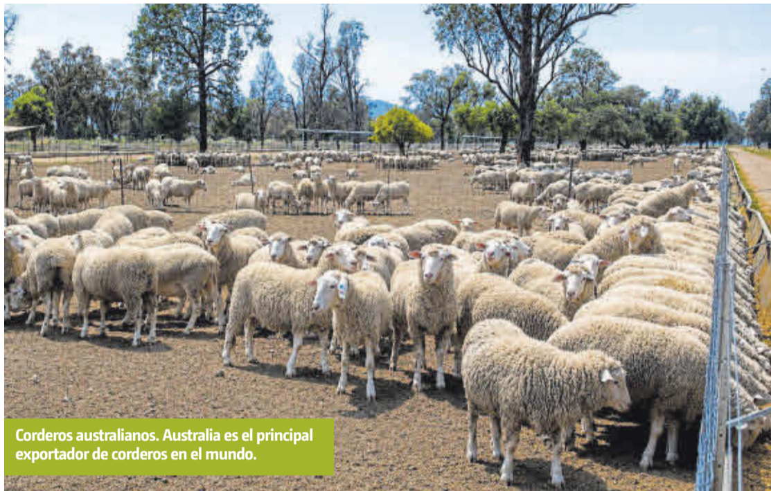
Corderos australianos. Australia es el principal exportador de corderos en el mundo.

El caso de Australia es muy diferente. Un país con una superficie quince veces superior a la de España, con unos 80 millones de ovejas, con un potencial de producción ovina casi ilimitado (ha llegado a tener 170 millones de ovejas) y una industria vinculada al sector de mataderos y comercializadores que funciona como un reloj suizo a la hora de abordar nuevos mercados. Sin embargo, como clientes de posibles productos europeos solo te-