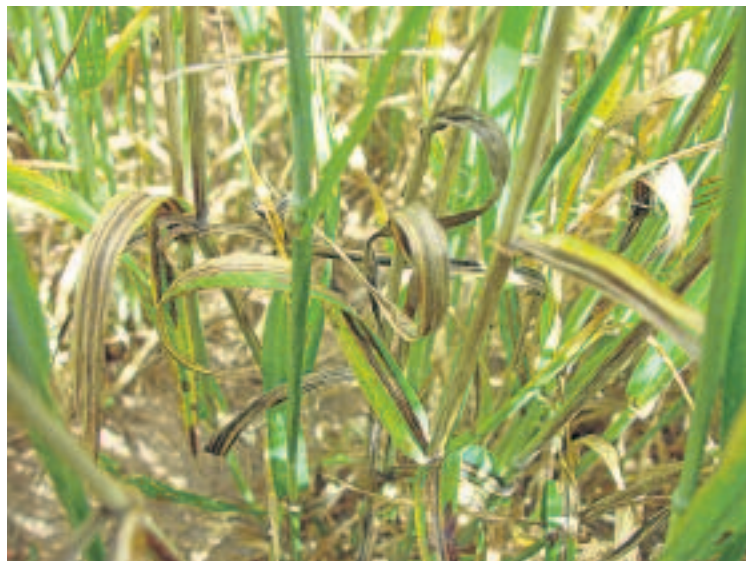
Planta con síntomas de Helmithosporium .

La utilización de semilla comercial, tratada correctamente con los productos autorizados tiene una incidencia final en la cosecha