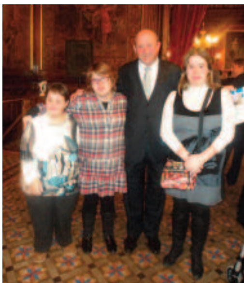
Miembros del Centro Ocupacional con el Presidente.

Lo más importante de esta creación ha sido el fin de la misma, aportar todo el beneficio de las ventas recaudadas a una entidad benéfica de la zona del Campo de Borja. Dicho y hecho, al mes apro-