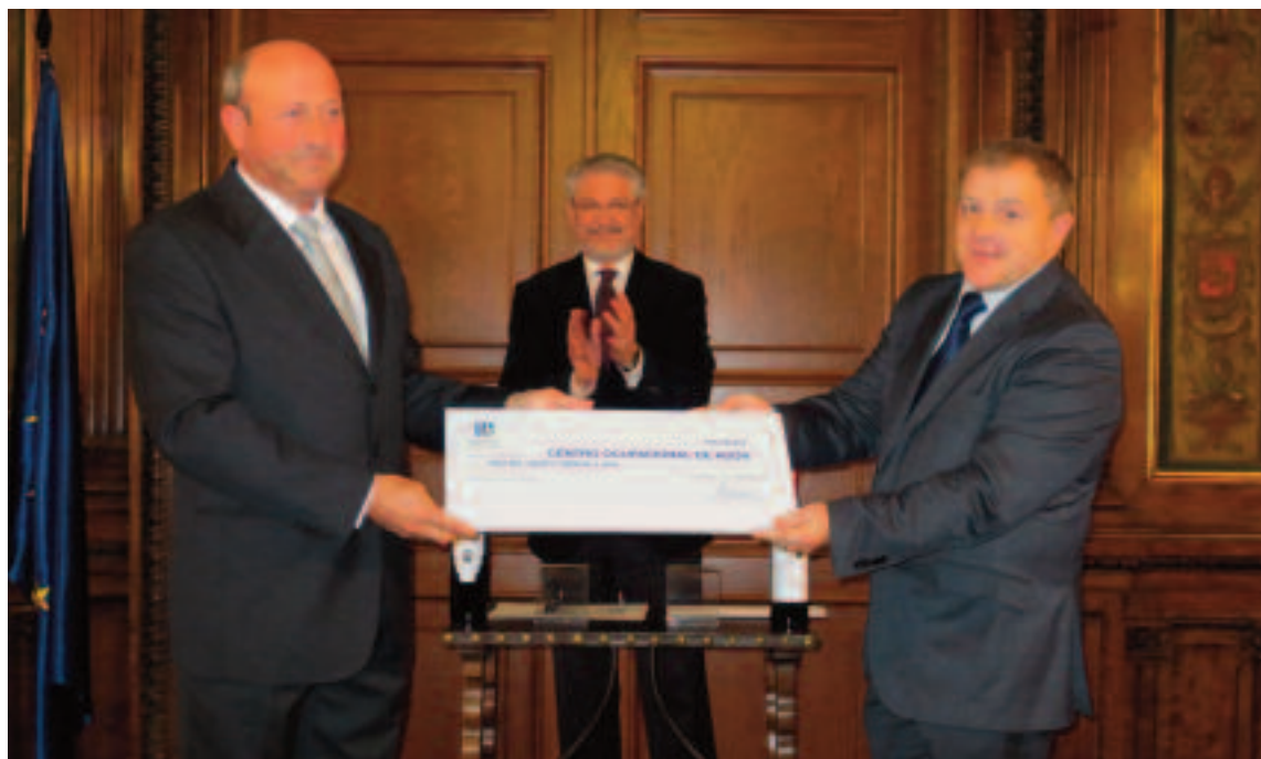
El Presidente hace entrega al Centro Ocupacional del cheque con la recaudación inicial de la venta del vino "Ecce Homo".