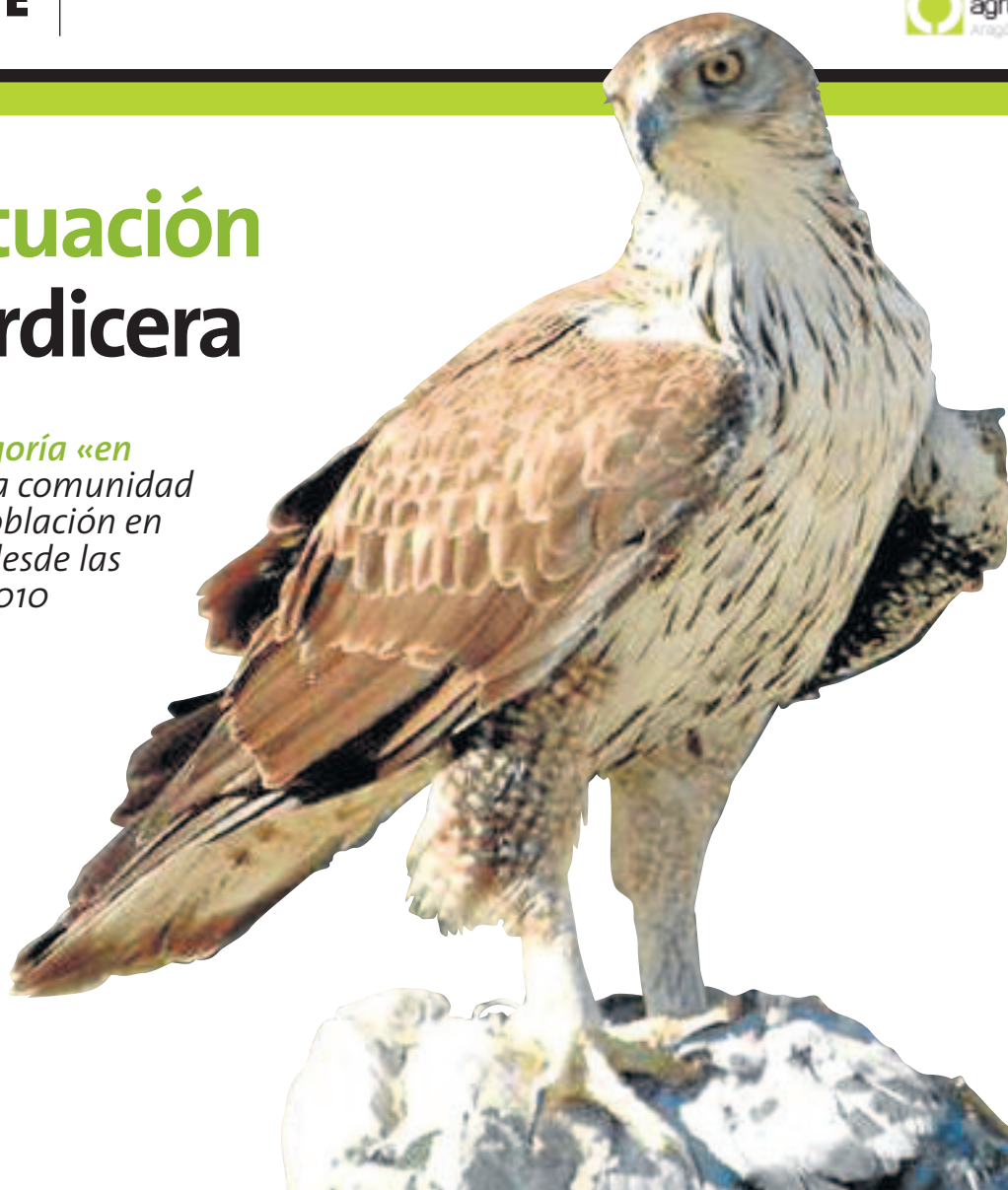
Águila perdicera.

Tienen dinero público porque cuidan de bienes públicos. Así de fácil y así de justo. Que se ponga en cuestión los pagos de la política agraria común es simple y llanamente hipocresía. Que a ningún productor se le ocurra dudar de la justificación social de los pagos, que bastante barato le sale a la sociedad. ■