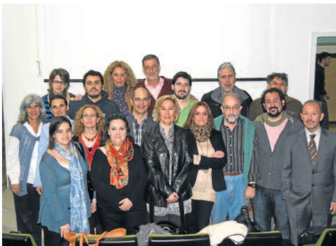
Miembros integrantes de ECOSAR y participantes en la jornada de presentación del directorio.

El objetivo de esta presentación es proporcionar a la Sociedad la información básica de entidades de Economía Social de Aragón, mostrando la diversidad de acti-