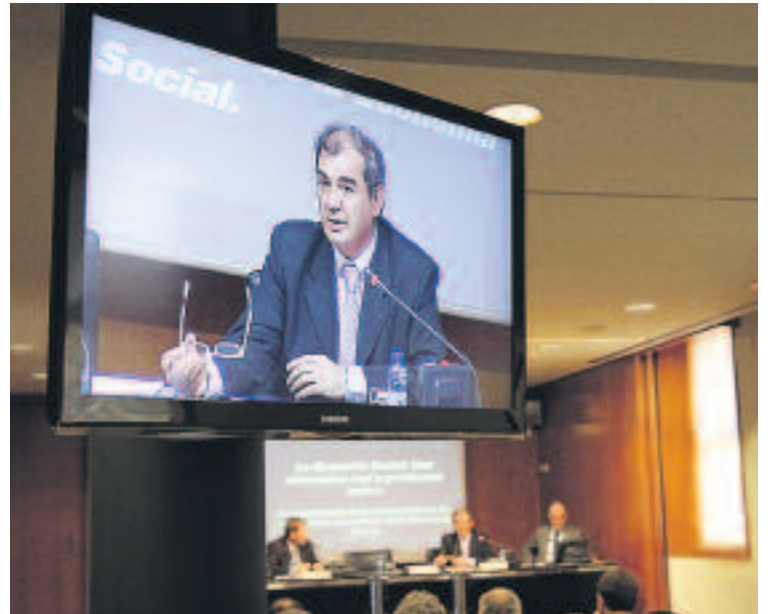
El presidente de CEPES durante su intervención.

Ni los principios ni la actividad económica que desarrolla la Banca Ética nos son ajenos. “La exclusión de los valores y la ética de la economía no es inocente”. Esta entidad coloca gran parte de sus depósitos en las cooperativas de crédito, que también forman par-