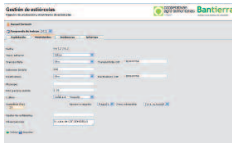
Vista de la aplicación informática