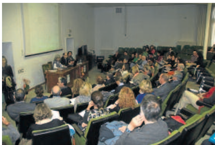
Jornada de presentación del directorio de ECOSAR.

Las entidades de la Economía Social representan un 3,5 % del PIB