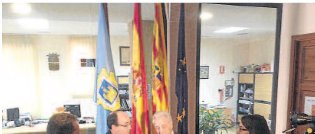
El Consejero durante su visita a Sádaba.

Dados los distintos departamentos que pueden tener competencias en la evaluación de los daños ocurridos, se le pide al Consejero que realice la labor de coordinación de los mismos, además de