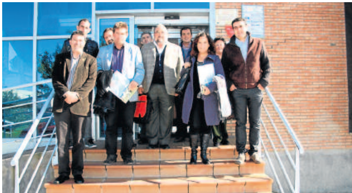
Miembros de la Plataforma visitan las instalaciones de la Cooperativa.