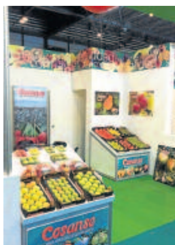
Cosanse en Fruit Attraction 2012.

Para la comercialización de los productos de Cosanse, se confirma como muy importante la presencia en estos certámenes que sirven como punto de encuentro con clientes habituales y como punto de contacto con nuevas potenciales oportunidades, así como una actualización de todas las novedades