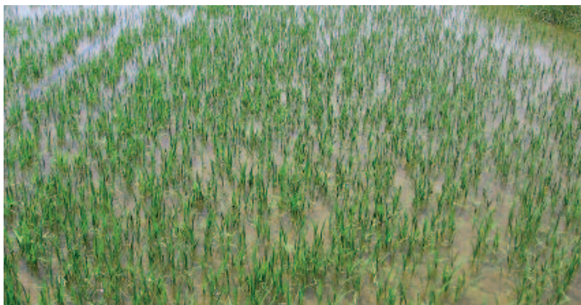
Nascencia arroz.

arroz de malas hierbas: Echinochloa spp., ciperáceas y dicotiledóneas, en dos zonas diferentes de Aragón