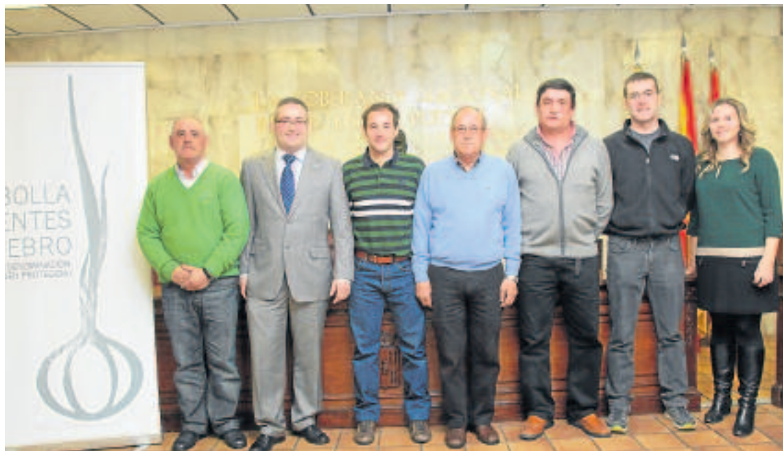
Consejo Regulador DOP Cebolla Fuentes de Ebro.