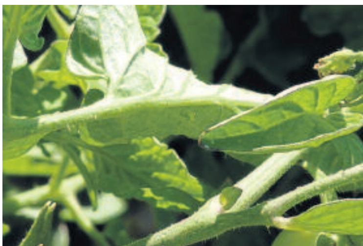
Adulto de Macrolophus caliginosus .

Los daños directos los provocan tanto los adultos como las larvas al alimentarse provocando deformaciones en las zonas afectadas dejando las hojas abullonadas. Los daños afectan sólo a las hojas haciendo disminuir la actividad fotosintética, muy importante an-