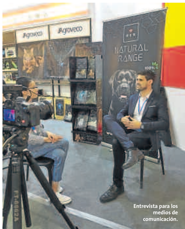
Entrevista para los medios de comunicación.

Tras los eventos de Yiwu, Agrovecó junto a otras 16 empresas se trasladaron a la región de Hangzhou,