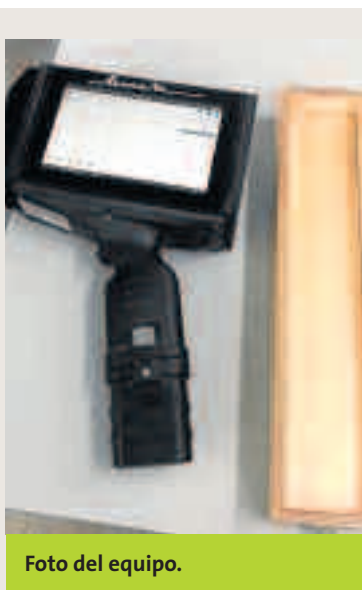
Foto del equipo.

N os alegra informar que la Cooperativa Ganadera de Caspe es pionera a nivel europeo en el uso del equipo NIR Aurora para el control de calidad en la producción de piensos. Se trata de un equipo de portátil que permite realizar análisis NIR a tiempo real fuera del laboratorio, ofreciendo la posibilidad de realizar analíticas en campo y facilitando el análisis de las materias primas antes de su descarga y su posterior clasificación puesto que la cantidad de muestra analizada es mayor. ■