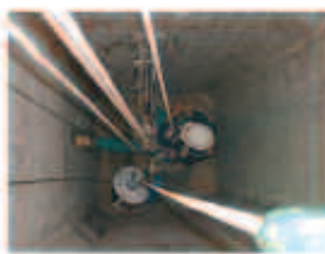
Limpeza y mantenimiento de silos