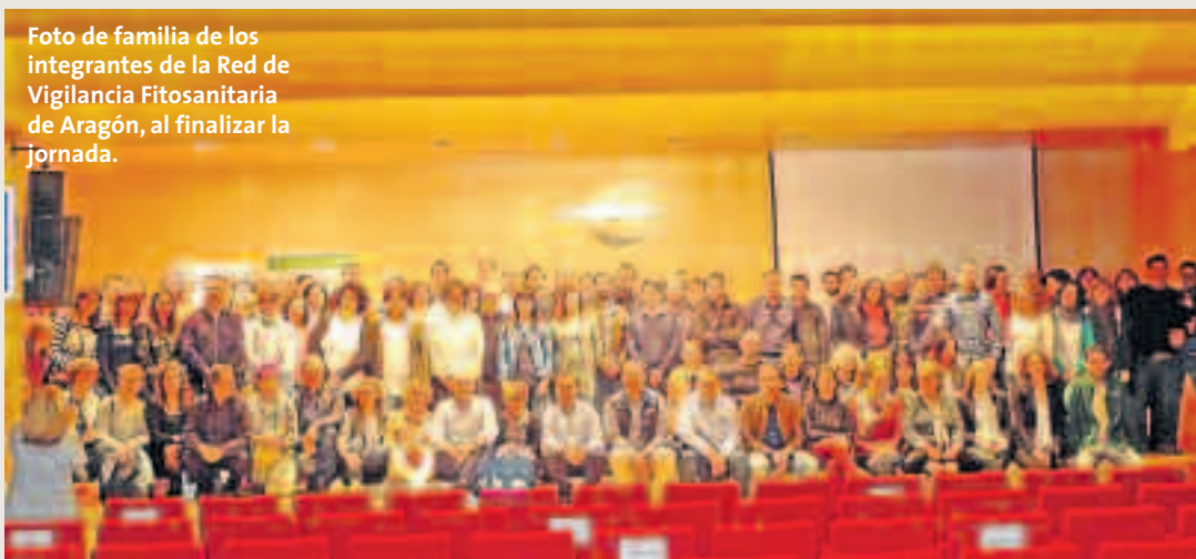
Foto de familia de los integrantes de la Red de Vigilancia Fitosanitaria de Aragón, al finalizar la jornada.

El Consejero de Desarrollo Rural y Sostenibilidad del Gobierno de Aragón, Joaquín Olona, reconoció el papel de la Red de Vigilancia Fitosanitaria de Aragón, destacando el papel de las ATRIAS y el de Cooperativas Agroalimentarias en el funcionamiento de esta, lo que evidencia que la cooperación de organismos públicos y privados puede resultar muy eficiente. ■