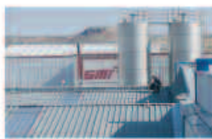
Lineas de vida y mantenimiento de cubiertas