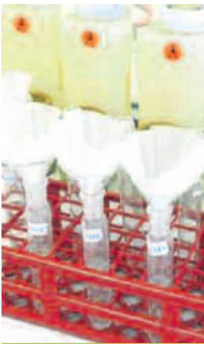
Filtrado del producto de digestión de abonos orgánicos para su posterior determinación.

Tradicionalmente, en las solicitudes de análisis han predominado los encargos sobre fertilizantes minerales, pero cada vez es más importante la demanda de análisis de subproductos de todo tipo, fundamentalmente orgánicos procedentes de la ganadería, pero también de subproductos de la industria agro-