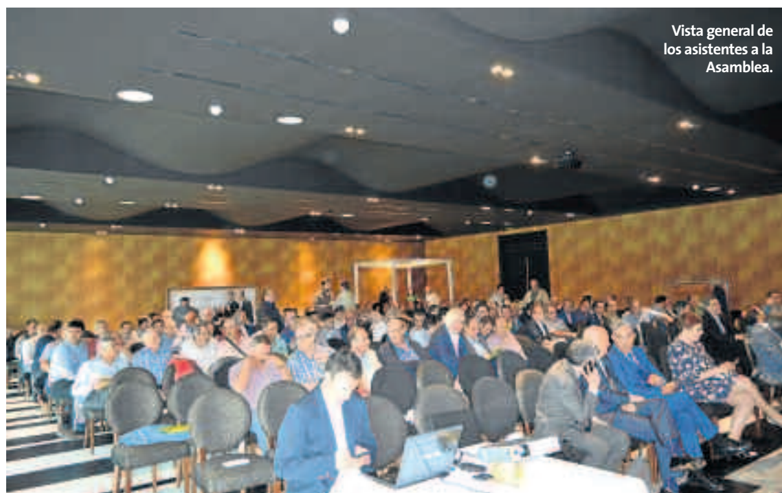
Vista general de los asistentes a la Asamblea.