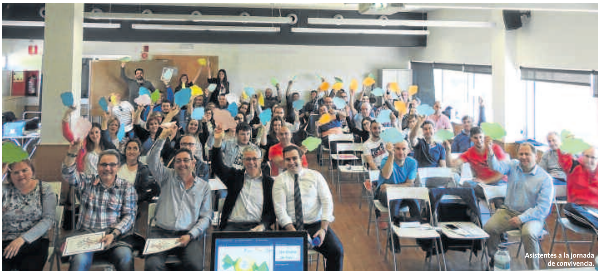
Asistentes a la jornada de convivencia.