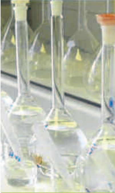
Preparación de diluciones de extractos de muestras fertilizantes.

alimentaria (vinazas, alpechines, sueros lácteos, etc.), o de subproductos urbanos o de la industria no alimentaria (compost, lodos, restos de papelera, etc.).