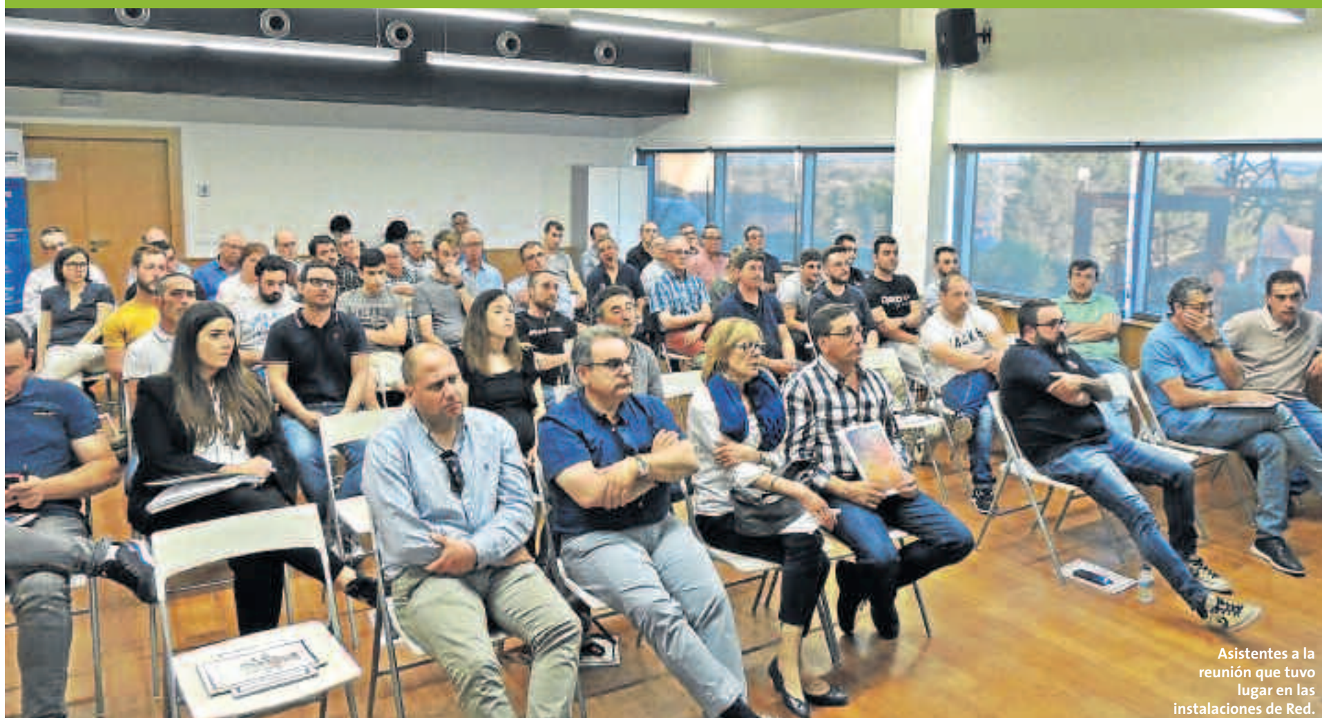
Asistentes a la reunión que tuvo lugar en las instalaciones de Red.