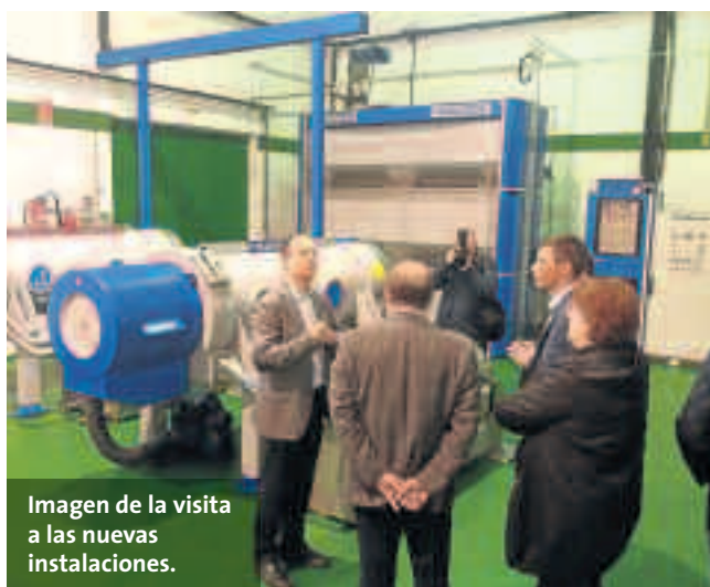
Imagen de la visita a las nuevas instalaciones.

La comercialización se produce en todo el territorio nacional, en varias cadenas de supermercados, tiendas tradicionales y algunos restaurantes. La exportación aún es en ocasional y en pequeño volumen, pero dirigida principalmente al mercado gourmet y al mercado europeo. ■