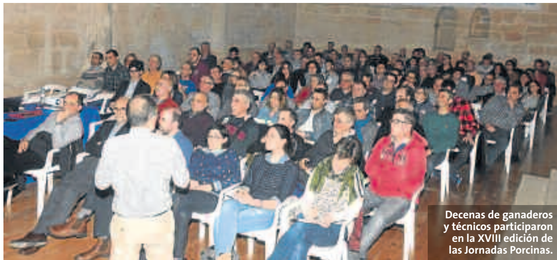
Decenas de ganaderos y técnicos participaron en la XVIII edición de las Jornadas Porcinas.