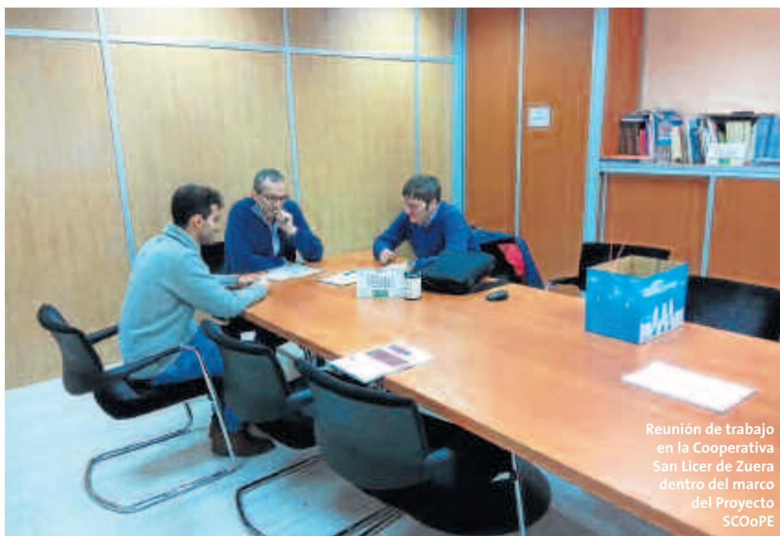
Reunión de trabajo en la Cooperativa San Licer de Zuera dentro del marco del Proyecto SCOoPE

El proyecto SCOoPE se centra en realizar auditorías energéticas y posteriormente en transferir las