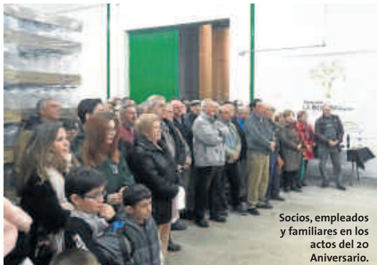
Socios, empleados y familiares en los actos del 20 Aniversario.