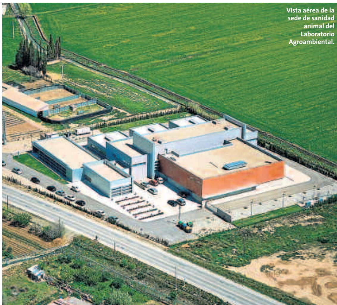
Vista aérea de la sede de sanidad animal del Laboratorio Agroambiental.

La labor del Laboratorio se reparte entre atender a los análisis para la propia Administración (fundamentalmente para inspección y control de fraudes) y los análisis a entidades privadas y particulares. Cualquier persona, física o jurídica, puede solicitar análisis de nuestra cartera de servicios, sin más que presentar un formulario (disponible en nuestras sedes o en la Web - ver dirección abajo -). Nuestros precios públicos cuentan con importantes reducciones