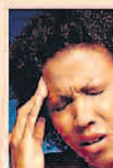
accidentes y baja diaria

Correduría de Seguros Arcoiris del Maestrazo, S.L.U. - NIF: B-44298254 - Registro Mercantil de Teruel, Tomo 220, Folio 204, Hoja TE-4132, Inscripción 1ª