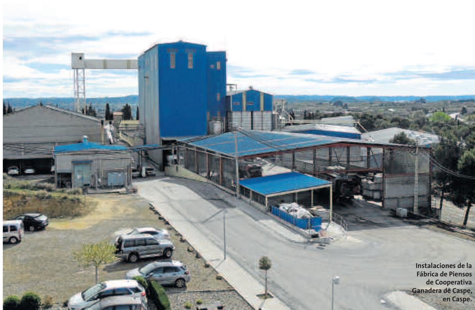
Instalaciones de la Fábrica de Pienso de Cooperativa Ganadera de Caspe, en Caspe.

Cooperativa Ganadera de Caspe aplica los últimos conocimientos en el campo de la formulación para ajustar las dietas a cada momento productivo y a la disposición de materias primas. Los mercados de