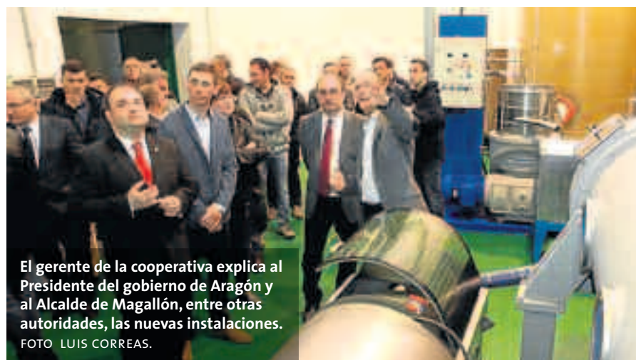
El gerente de la cooperativa explica al Presidente del gobierno de Aragón y al Alcalde de Magallón, entre otras autoridades, las nuevas instalaciones.

La ocasión se aprovechó también para degustar el nuevo aceite de la última cosecha: de 2017, con Pago La Corona – Melange, con una nueva presentación: nueva etiqueta y botella. Esta va dirigido a tiendas gourmet, hostelería de algo nivel y exportación. El envase utilizado es una bonita bote-