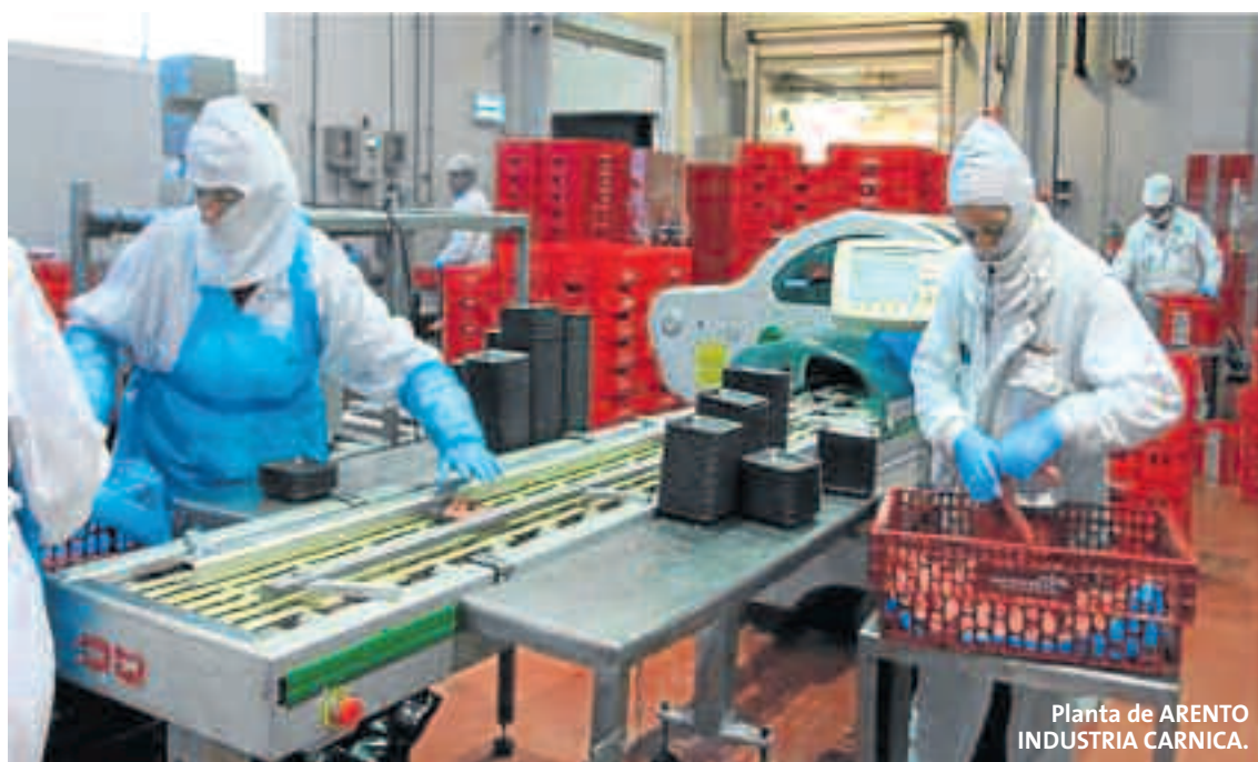
Planta de ARENTO INDUSTRIA CÁRNICA.

instalaciones industriales auxiliares o "facilities", que son los sistemas adjuntos al proceso productivo principal, sin los que la producción no puede llevarse a cabo (aire comprimido, clima, agua de proceso, instalación eléctrica de distribución, iluminación, HVAC...) tienen un consumo energético mayor del 90% del total en el sector de transformación cárnica.