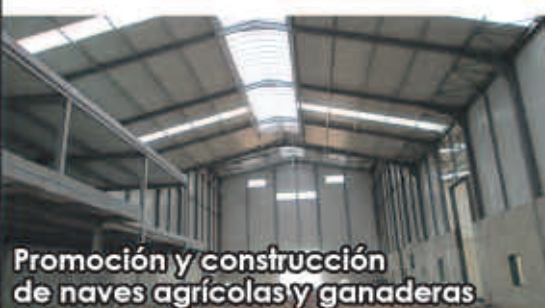
Promoción y construcción de naves agrícolas y ganaderas

Polígono Valdeferrín, Parc. R-132-133 50600 Ejea de los Caballeros (Zaragoza)