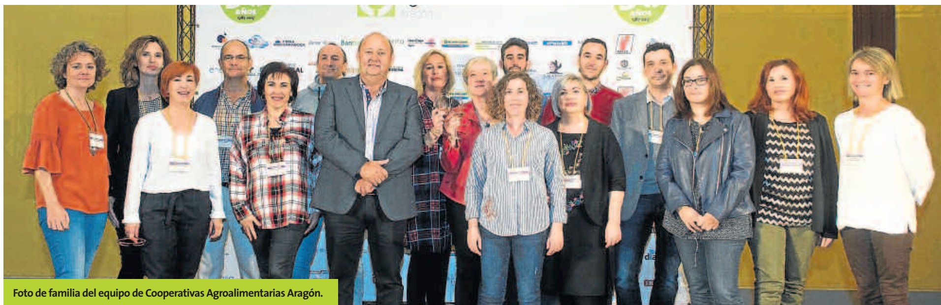
Foto de familia del equipo de Cooperativas Agroalimentarias Aragón.

Mira todas las fotos y el video íntegro de la fiesta en www.faca.es