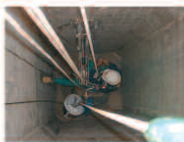
Limpieza y mantenimiento de silos