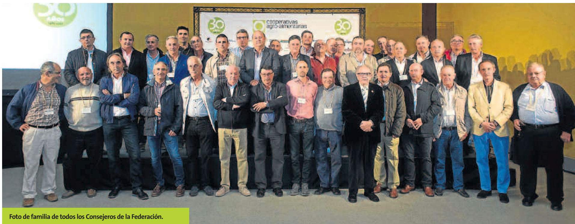
Foto de familia de todos los Consejeros de la Federación.

Mira todas las fotos y el video íntegro de la fiesta en www.faca.es