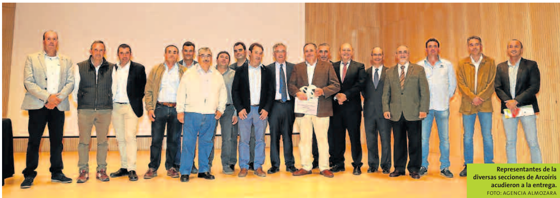
Representantes de la diversas secciones de Arcoíris acudieron a la entrega.