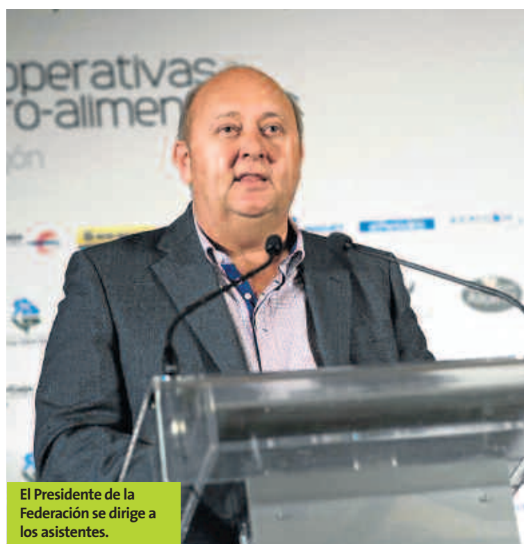
El Presidente de la Federación se dirige a los asistentes.