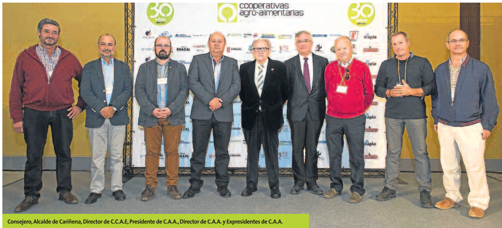
Consejero, Alcalde de Cariñena, Director de C.C.A.E, Presidente de C.A.A., Director de C.A.A. y Expresidentes de C.A.A.

Mira todas las fotos y el video íntegro de la fiesta en www.faca.es