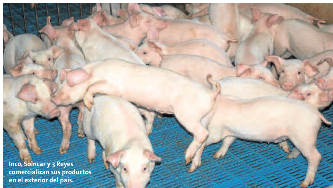
Inco, Soincar y 3 Reyes comercializan sus productos en el exterior del país.

Entre el año 2019 y 2020 se establecerán las estrategias en función de los resultados, se valorarán los resultados y se cuantificarán los costes