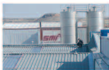
Líneas de vida y mantenimiento de cubiertas