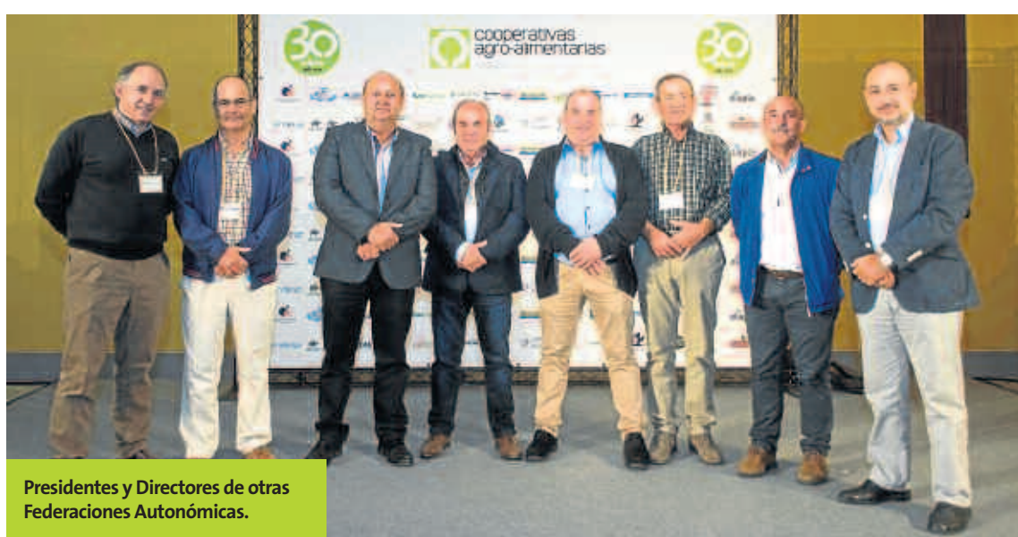
Presidentes y Directores de otras Federaciones Autonómicas.