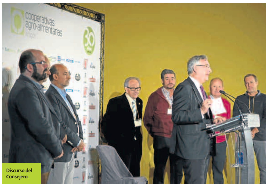
Discurso del Consejero.