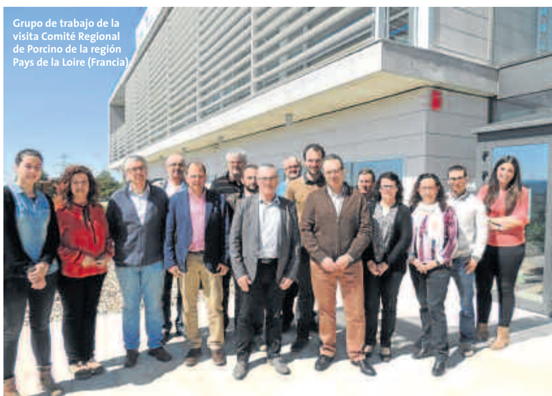
Grupo de trabajo de la visita Comité Regional de Porcino de la región Pays de la Loire (Francia).

La jornada comenzó a las 10 de la mañana con la recepción de los asistentes por la Dirección General, para tratar diferentes temas con los técnicos y especialistas de la cooperativa, comida en las instalaciones de Red Ganadera Caspe en la que todos pudimos comentar temas de interés e intercambio de impresiones. ■