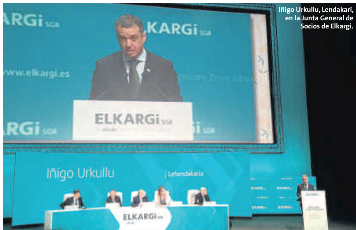
Iñigo Urkullu, Lendakari, en la Junta General de Socios de Elkargi.

Cooperativa Ganadera de Caspe firmó en el año 2015 un Convenio de colaboración con Oinarri, SGR para procurar el acceso a la financiación a sus socios y mejorar sus condiciones a través de