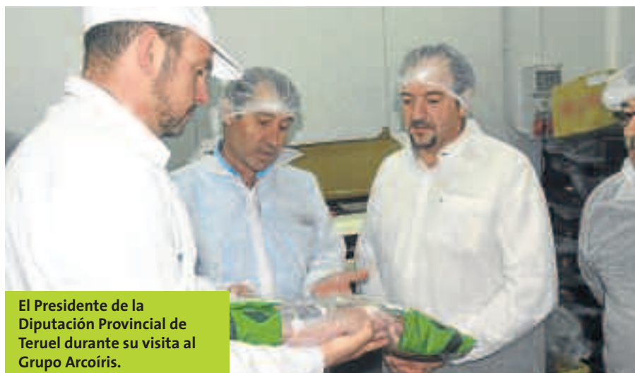
El Presidente de la Diputación Provincial de Teruel durante su visita al Grupo Arcoíris.