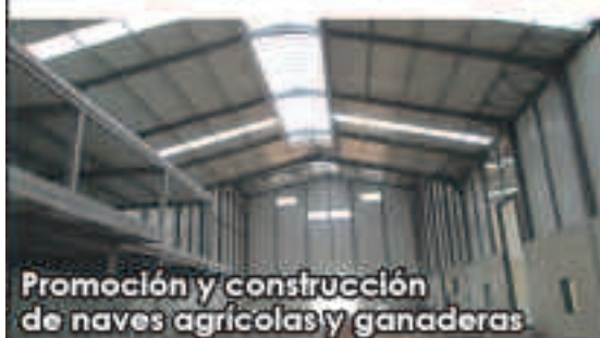
Promoción y construcción de naves agrícolas y ganaderas

Polígono Valdeferrín, Parc. R-132-133 50600 Ejea de los Caballeros (Zaragoza)