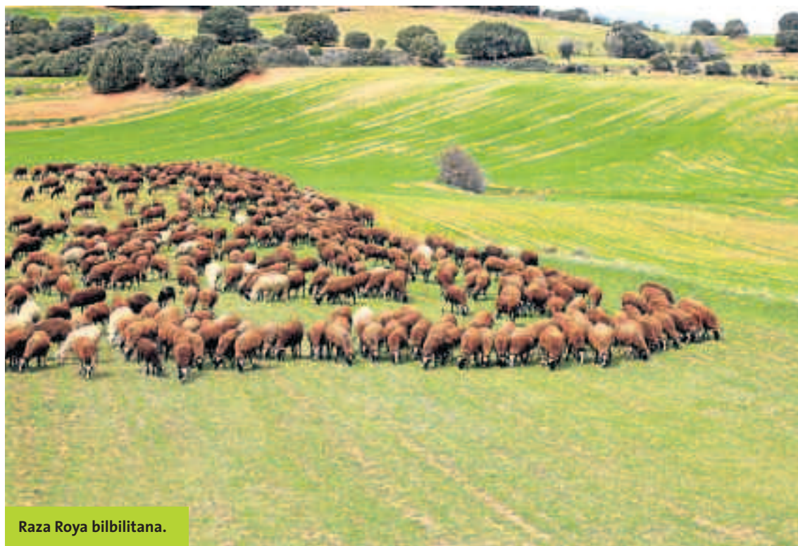
Raza Roya bilbilitana.

Para finalizar, debemos expresar nuestra honda preocupación por la progresiva disminución de las ayudas económicas destinadas a la conservación, fomento y mejora de las razas autóctonas, (tanto a asociaciones como a ga-