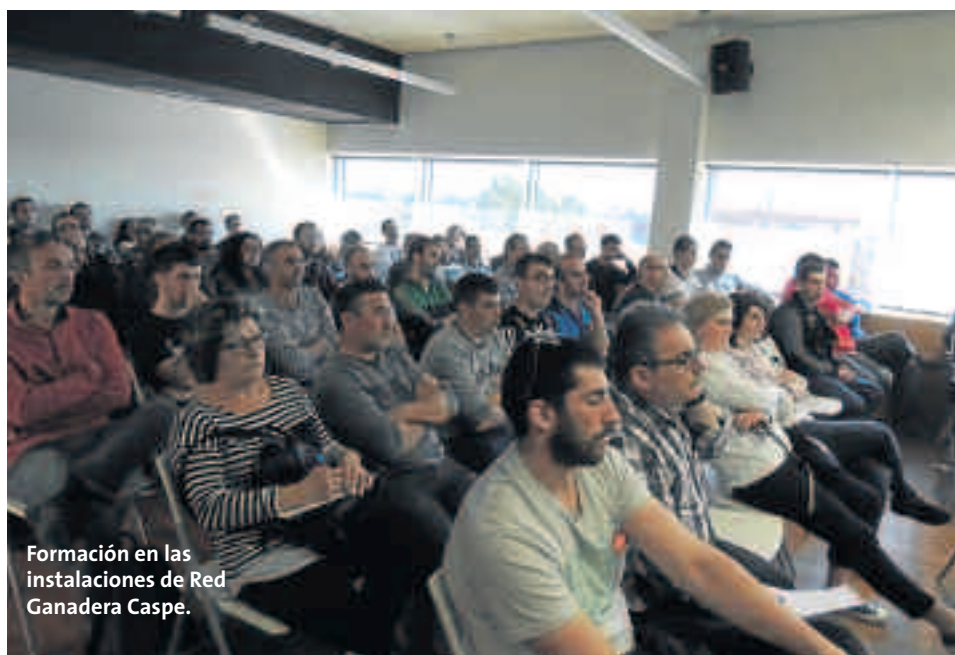
Formación en las instalaciones de Red Ganadera Caspe.