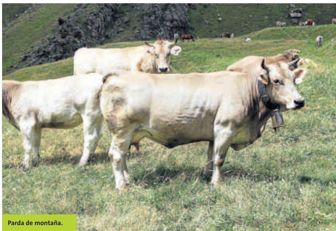
Parda de montaña.

Cada vez que se pierde, que desaparece, que se erosiona, una especie, una raza, una variedad, se pierde un libro original de nuestra historia, de nuestro patrimonio, se pierde una parte de nuestro pasado, de nuestro presente, de nuestro futuro. ■