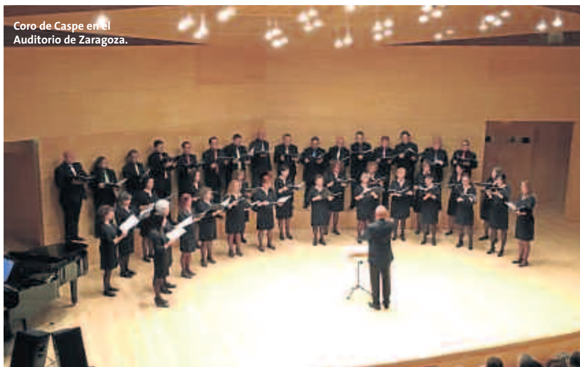
Coro de Caspe en el Auditorio de Zaragoza.

Participa también en la organización conjuntamente con el CEC-BAC de los Talleres de Canto Coral de Caspe que se realizan todos los