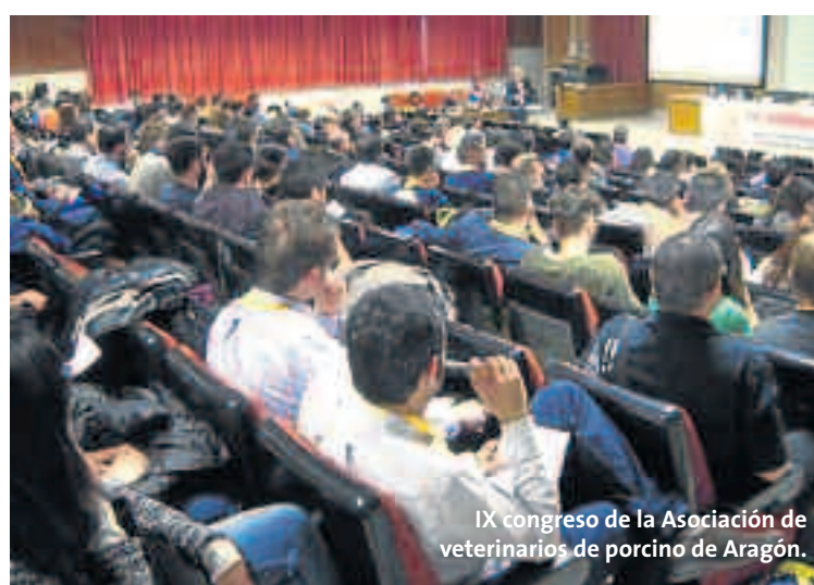
IX congreso de la Asociación de veterinarios de porcino de Aragón.

2. Un cambio en la estructura de costes puede generar tensiones integrado-integrador