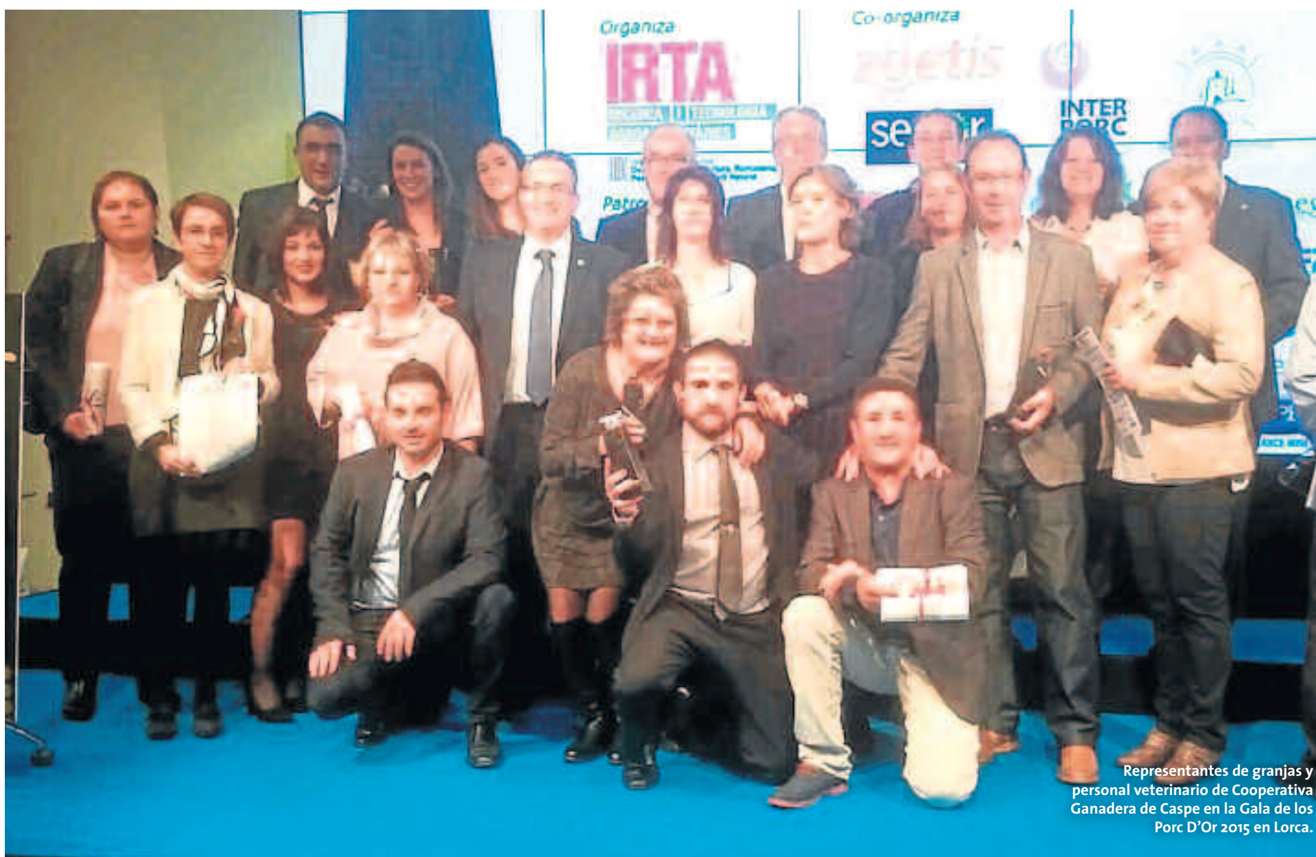
Representantes de granjas y personal veterinario de Cooperativa Ganadera de Caspe en la Gala de los Porc D'Or 2015 en Lorca.