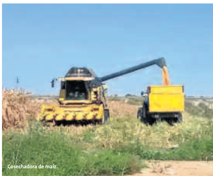
Cosechadora de maíz.

- Antes del comienzo de la campaña y a su conclusión limpie cuidadosamente toda la cosechadora, tanto interna como externamente. Ponga en marcha la cosechadora durante algunos minutos, con todas las ventanas y tapas de inspección abiertas, y haga la limpieza con aire comprimido o aspiradora industrial. Limpie las zarandas, cribas y la