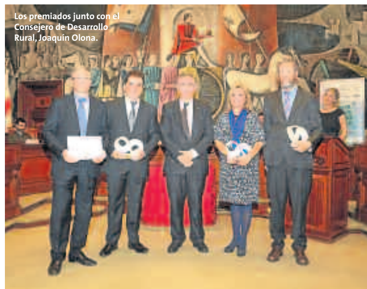
Los premiados junto con el Consejero de Desarrollo Rural, Joaquín Olona.