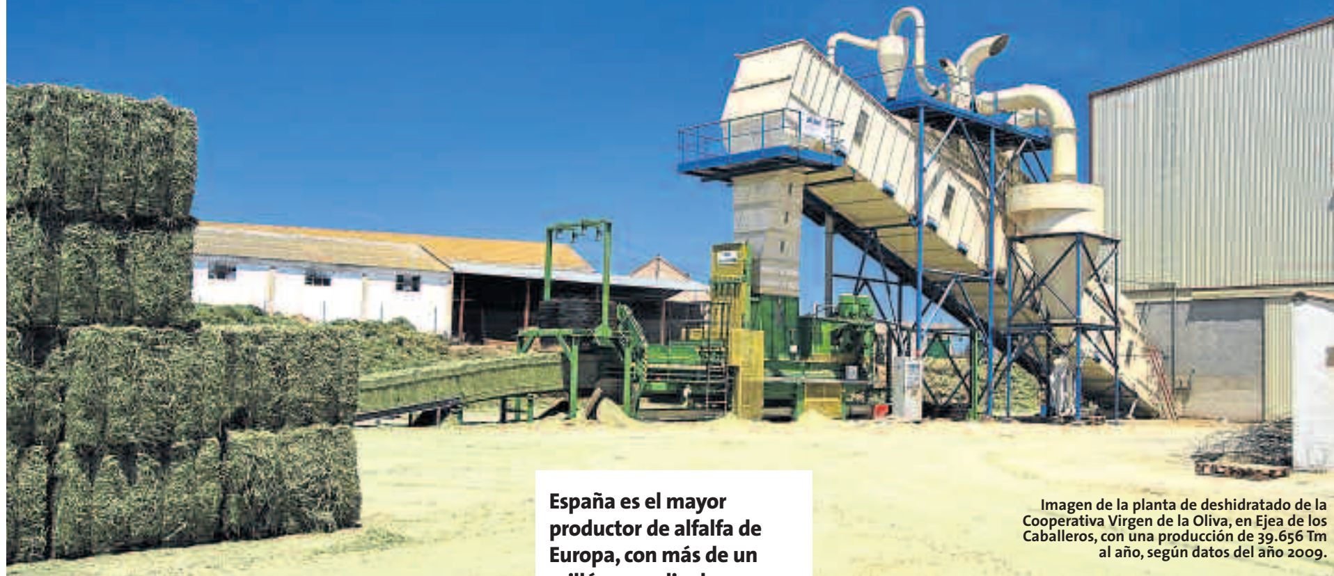
Imagen de la planta de deshidratado de la Cooperativa Virgen de la Oliva, en Ejea de los Caballeros, con una producción de 39.656 Tm al año, según datos del año 2009.