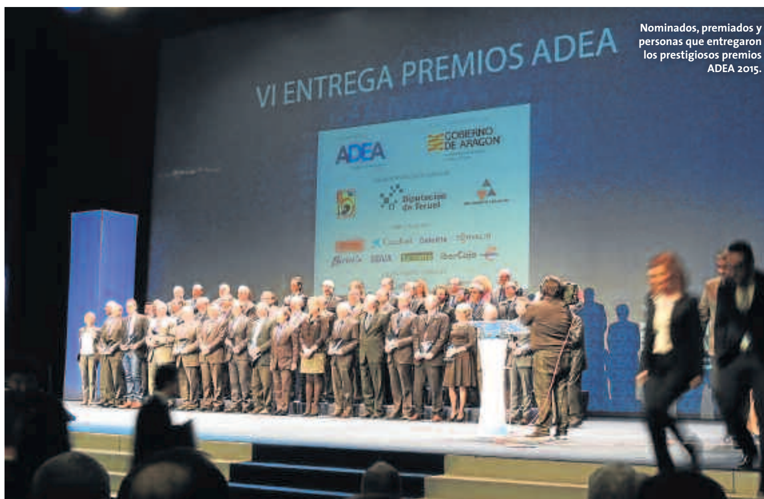
Nominados, premiados y personas que entregaron los prestigiosos premios ADEA 2015.