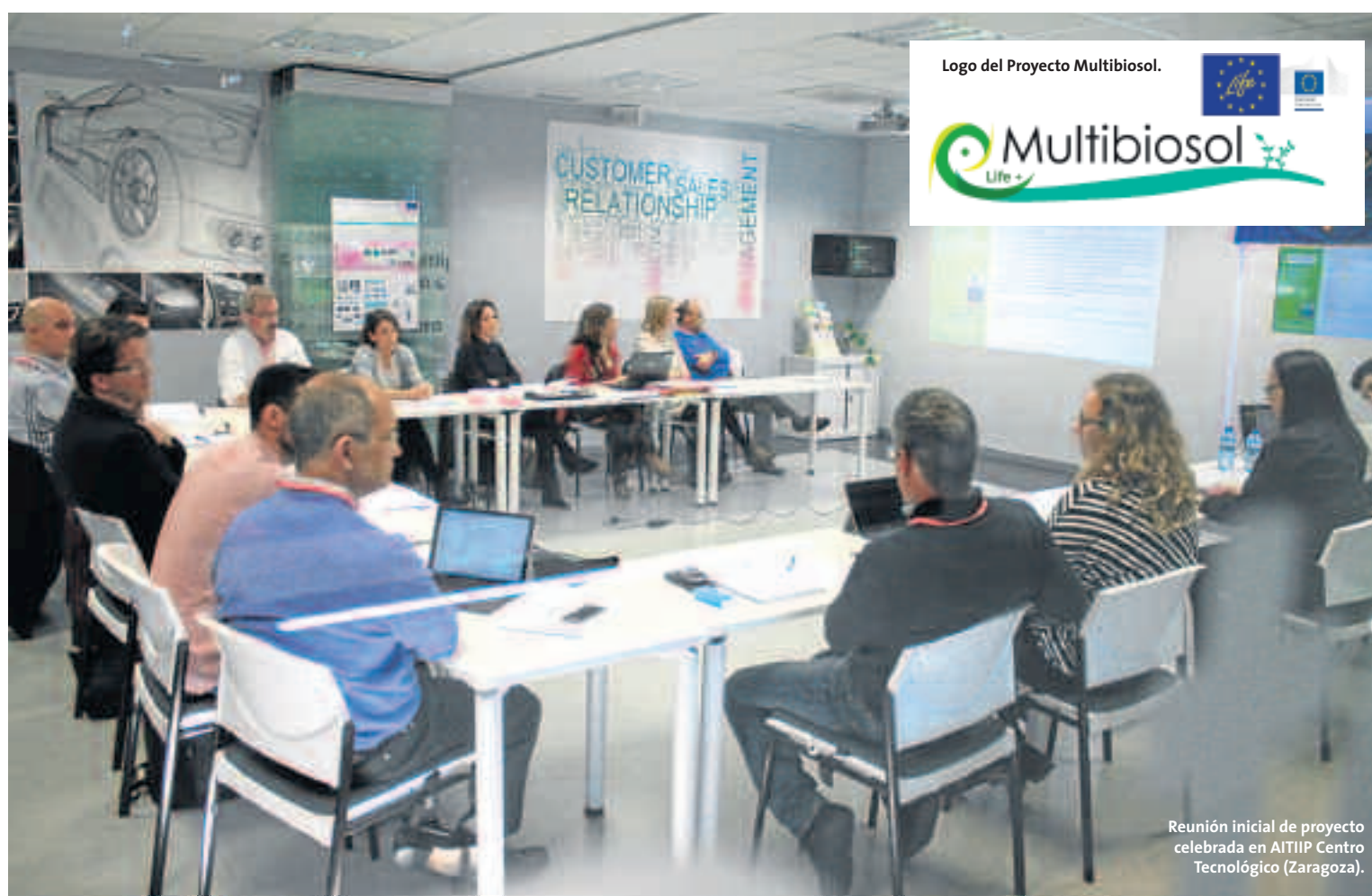
Reunión inicial de proyecto celebrada en AITIIP Centro Tecnológico (Zaragoza).