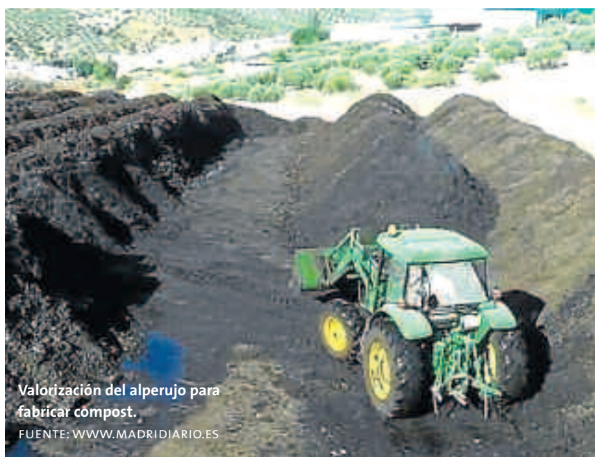
Valorización del alperujo para fabricar compost.

El purín de cerdo es un compuesto de origen orgánico, formado principalmente por las excreciones líquidas y sólidas de los cerdos, así como aguas de lavado de granjas. En los últimos años, el sector porcino en Aragón ha ido incrementando año a año el número de cabezas, así como el número de explotaciones. Actualmente en Aragón, se cifra la cantidad de plazas de cerdos en más de 6 millones (segundo productor nacional, muy cercano a Cataluña, que es el primero), además de un crecimiento de casi 1 millón de plazas en los últimos 4 años. Este crecimiento, lleva asociado un aumento importante de la cantidad de purín que se genera en el conjunto de las explotaciones aragonesas, y el cuál hay que gestionar de manera adecuada para poder aplicarlo si se puede en campo, y así utilizar un compuesto que principalmente es de desecho, en un producto útil para el campo. Según datos publi-