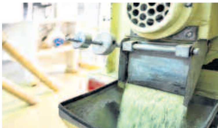
En el molino es donde se empaquetan y controlan los paquetes de arroz Brazal.

mercados del Alto Aragón, Covirán, Coalimen y 7 alimentación, además de bastantes tiendas especializadas. Pero es necesario ampliar el ámbito geográfico de la distribución.