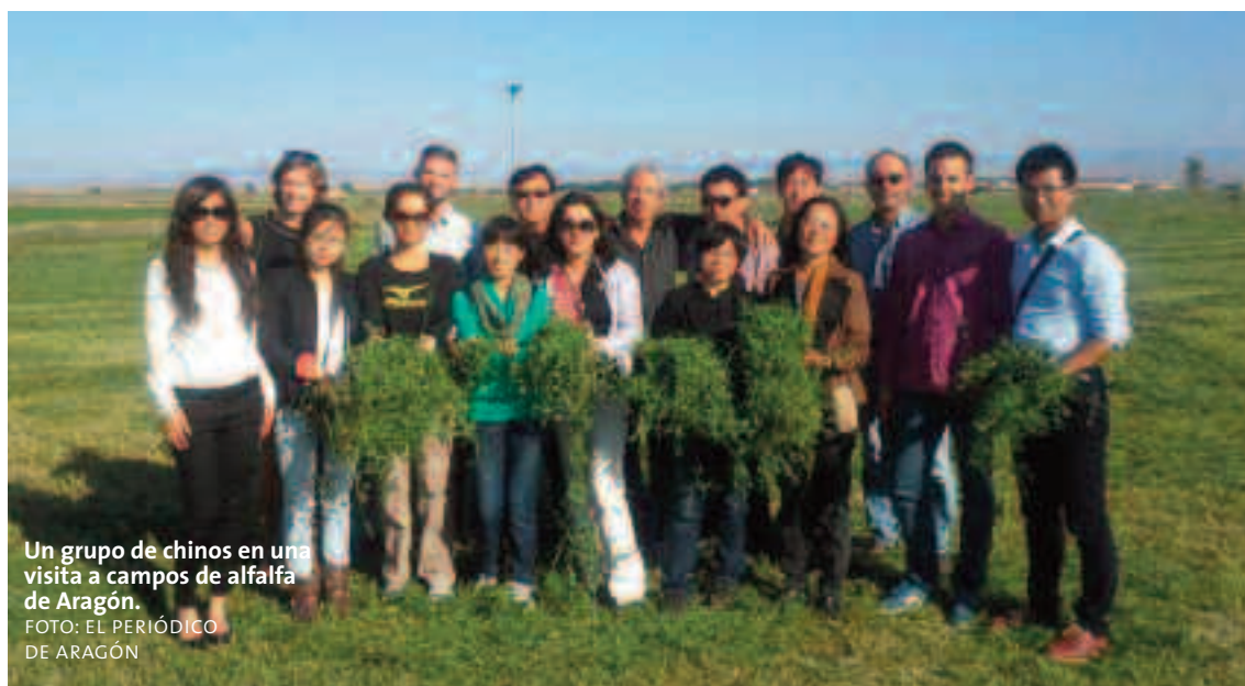
Un grupo de chinos en una visita a campos de alfalfa de Aragón.

C ooperativa Virgen de la Oliva cuenta desde mediados del pasado año con la homologación oficial por parte del Ministerio de Agricultura, Alimentación y Medio Ambiente (MAGRAMA) para la exportación de alfalfa a China. La necesidad por parte del país oriental de este tipo de forraje le hace buscar proveedores en Europa, y especialmente en España, puesto que es uno de los principales productores mundiales de alfalfa. De las 24 empresas autorizadas para la exportación de alfalfa en toda España, la