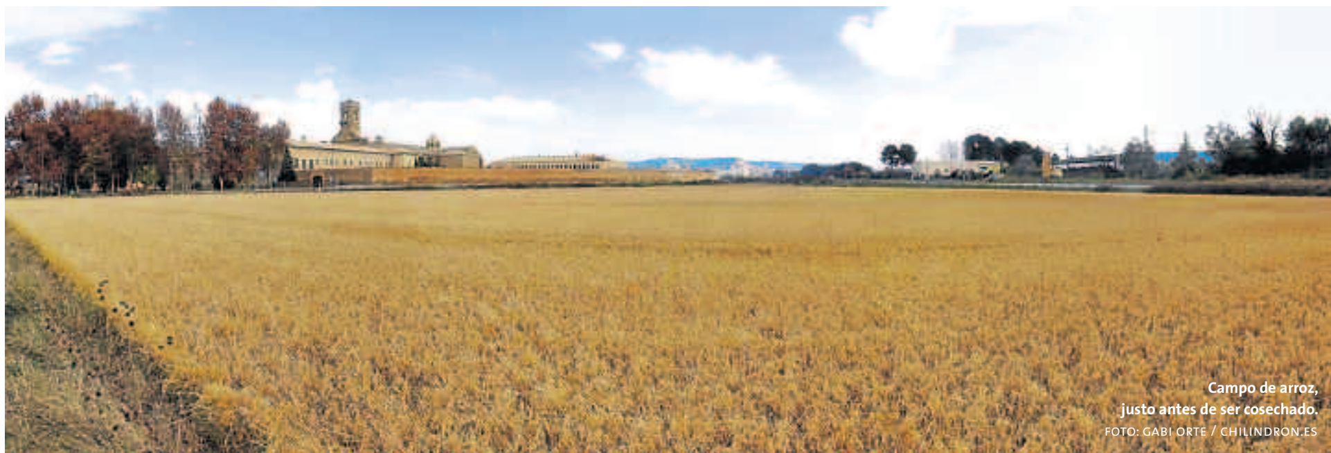
Campo de arroz, justo antes de ser cosechado.