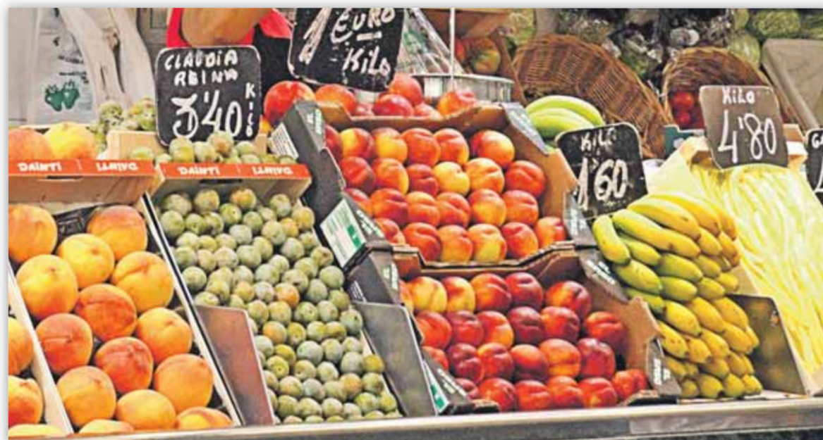
La reconversión de variedades de frutales es de vital importancia

en 2006, se han arrancado y reconvertido 1.584 hectáreas de frutales en Aragón, a cierre de edición de esta publicación, según fuentes del Gobierno autónomo, con una ayuda de 7,5 millones de euros. Las coopera-