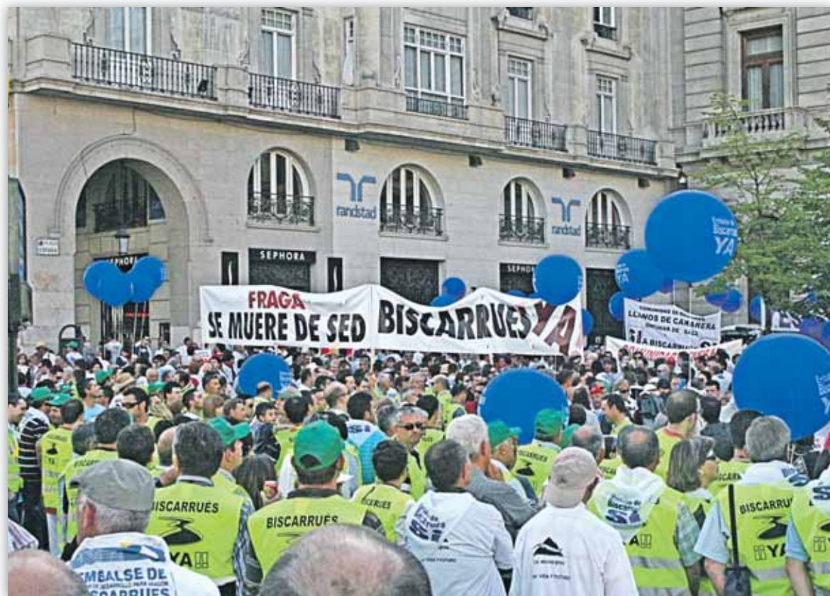
A la manifestación acudieron agricultores desde todos los puntos de Aragón