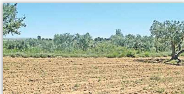
Con esta medida se reduce el riesgo de empleo irregular en el campo

Con esta modificación se pretende, en definitiva, ampliar el núcleo de servicios que la cooperativa presta a sus socios, de manera que las la-