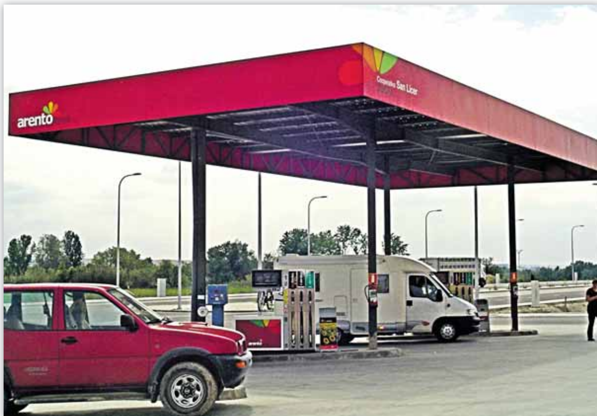
Las operaciones no podrán superar el 50% del total de las realizadas por las cooperativas con sus socios

♦ Mª Pilar Nogueras, Cooperativas Agro-alimentarias Aragón