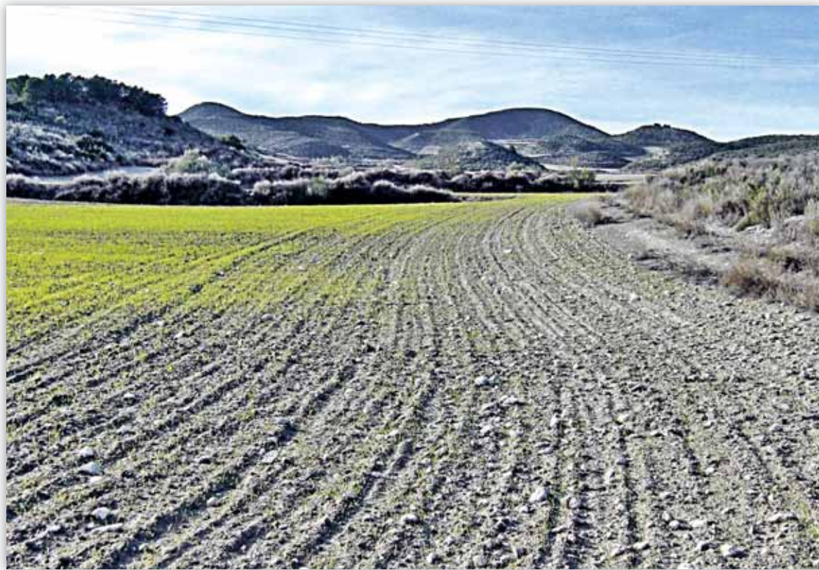
Parcela afectada por daños producidos por conejos.

En relación con el grave problema que suponen los daños producidos por especies de caza en las producciones agrarias Cooperativas Agro-alimentarias, las OPA's, el Ministerio de Medio Ambiente, Medio Rural y Marino, las Comunidades Autónomas y Agroseguro acuerdan incluir la cobertura de los daños provocados por la fauna cinegética en el marco del seguro agrario.