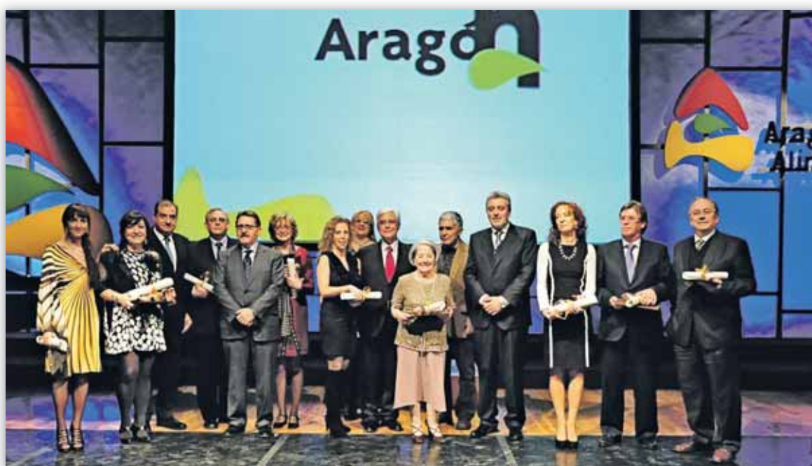
Foto de familia de los premiados