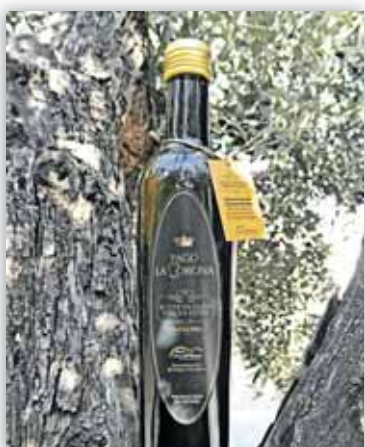
Inmejorable presentación de un extraordinario aceite

La Cooperativa Santo Cristo presenta Pago La Corona, su nuevo aceite con D. O.