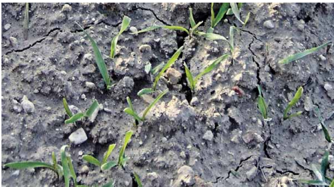
Detalle de los daños producidos en cereal de invierno.