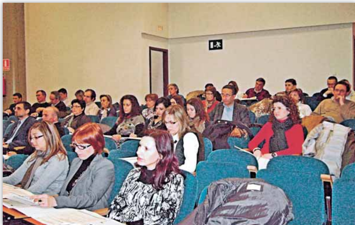
La jornada contó con un buen número de asistentes

Cooperativas Agro-alimentarias organizó una jornada en la que se analizaron las trece normas en las que se basa el Plan General de Contabilidad de Cooperativas 2011. En el transcurso de la misma, se hizo hincapié en que el Nuevo Plan introdujo un cambio en la calificación de las fuentes de financiación de las empresas y, por lo tanto, de su situación patrimonial. Trasladado esto a nuestras cooperativas, supone, con carácter general, que las aportaciones de los socios y otros partícipes a las mismas deban calificarse como pasivo, reduciendo de forma significativa los fondos propios de la entidad en la medida en que no otorguen a la Sociedad el derecho incondicional a rehusar su reembolso.