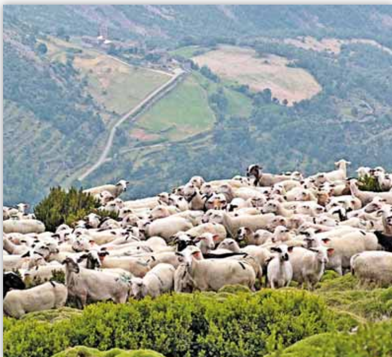
Las medidas se estructuran en cinco líneas relacionadas con la ganadería

Las de carácter específico supondrán un trasvase de 6,8 millones de euros desde la línea de rotación de cultivos hacia las líneas destinadas al apoyo del ovino-caprino, aumento de excepciones al enterramiento de cadáveres de ganado y abaratamiento de los sistemas actuales de gestión de cadáveres. Las medidas relacionadas con las mejoras de los mercados consisten en poner en el mercado los cereales de la intervención comunitaria. El MARM solicitará a la Comisión y a las Comunidades Au-