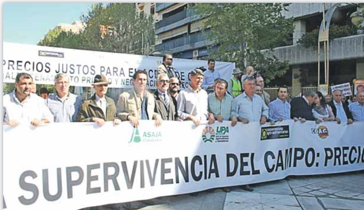
Las Cooperativas Agro-alimentarias de España se han manifestado en diferentes ciudades

La situación del aceite de oliva en la campaña 2010/2011 es la peor de la última década. Por ello, las Cooperativas Agro-alimentarias de España han presentado al Ministerio las carencias y necesidades que tiene este sector.