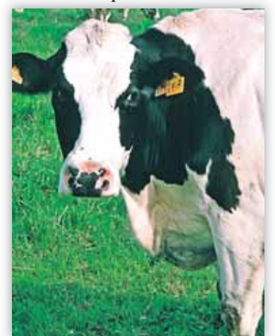
Bélgica podría volver a usar harinas animales

La ministra de agricultura belga, Sabine Laruelle, no se opone, pero desea que se limite a porcino y aves y añade que costará tiempo. •