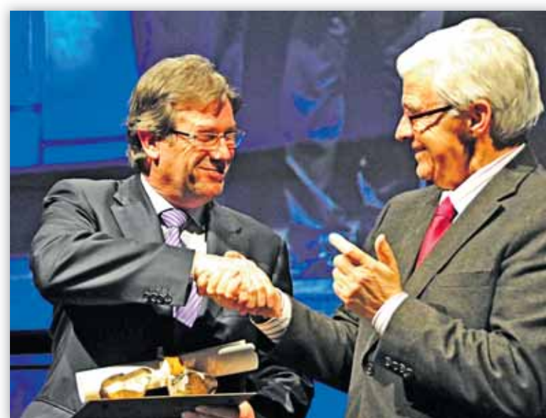
Momento de la recogida del premio

❖ Cooperativas Agro-alimentarias de Aragón