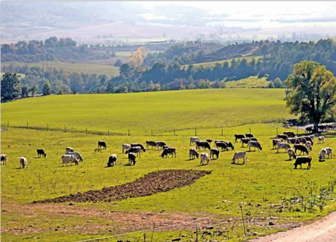
El Ministerio se ha comprometido a realizar otras actuaciones que puedan suponer la mejora de la ganadería

El Ministerio de Medio Ambiente, Medio Rural y Marino (MARM) propone medidas de apoyo para paliar la situación de crisis del sector ganadero, tras escuchar las peticiones de cooperativas y ganaderos. Las medidas se estructuran en cinco líneas básicas: de carácter financiero; de carácter fiscal; sectoriales, con planes de acción para cada sector, y reducción de los costes de explotación relacionadas con medidas preventivas de sanidad animal; para mejorar el funcionamiento de los mercados; de anticipo de los pagos directos de la PAC y aquéllas relacionadas con la comercialización de los productos ganaderos.