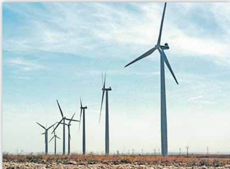
La apuesta por las energías renovables es uno de los pilares de la Ley

RACIONALIZACIÓN DE LA CONSTRUCCIÓN RESIDENCIAL. Las Administraciones Públicas adoptarán políticas que favorezcan la racio-