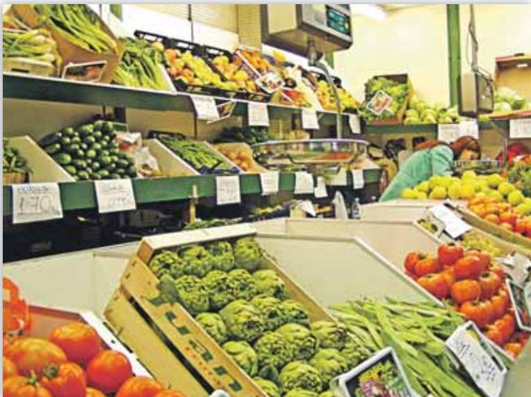
El documento simplifica el procedimiento de la cadena alimentaria