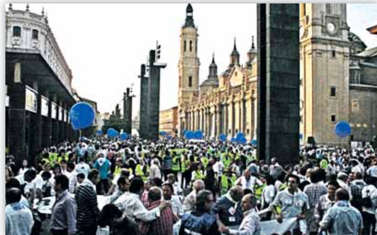
El acto reivindicativo finalizó en la Plaza del Pilar