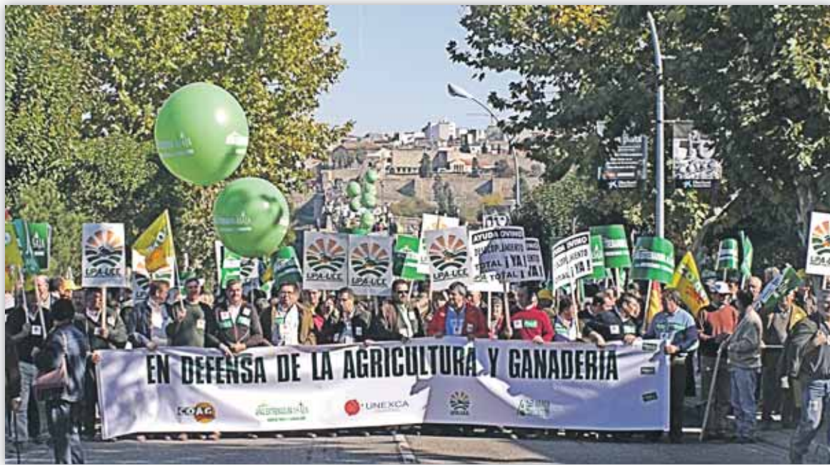
Manifestación que tuvo lugar en Extremadura en noviembre de 2008