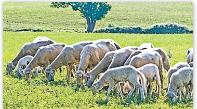
Reducirán la base imponible para ganaderos que adquieran a terceros más del 50% del pienso que utilizan en su explotación

❖ Yolanda Parrilla, Cooperativas Agro-alimentarias Aragón