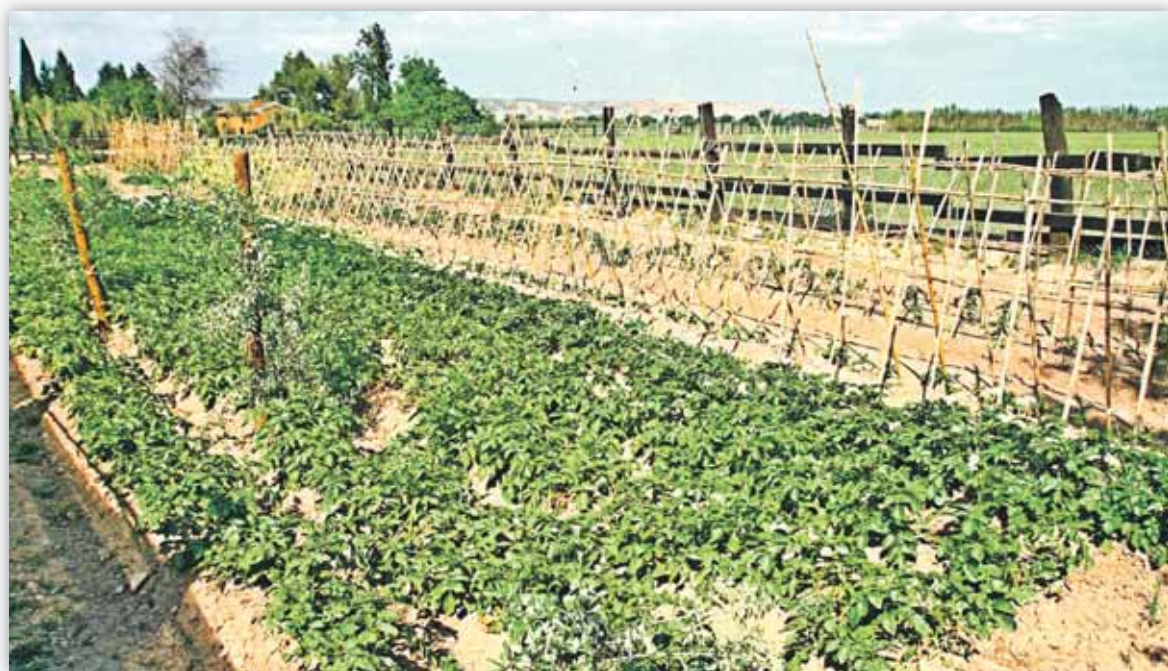
El 50% de la producción agrícola mundial se obtiene con fertilizantes

Según la Organización de las Naciones Unidas para la Agricultura y la Alimentación (FAO), el 50% de la producción agrícola a nivel mundial se obtiene gracias a la aplicación de fertilizantes y, si no fuera por ellos, sería necesario cultivar millones de hectáreas más. Poco más puede nadie decir a favor del uso de fertilizantes. Sabemos que la población del planeta muy probablemente llegará a unos 8.000 millones de personas alrededor del año 2030, y dos de cada tres personas vivirán en las ciudades. Esta situación, entre otras consecuencias, supondrá que en los próximos años la pro-