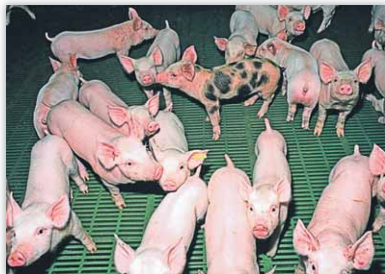
El futuro en los precios de la alimentación animal no es positivo

Los últimos acontecimientos de Japón han provocado la publicación de nuevas reglamentaciones que exigen controles, a