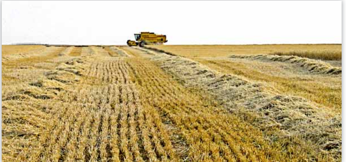
Los expertos señalan que la subida de precios se debe a las bajas cosechas en algunas partes del mundo

ver con el mercado físico y sí con el mercado financiero. Es cierto que unos buenos precios sostenidos en el tiempo, provocarán un aumento en la producción, pero ésta no se dará por igual en todos los países, ya que en unos llegará como consecuencia de un mayor número de hectáreas, en otros por unos mejores rendimientos y en otros por ambas. Para los países más tecnológicamente avanzados, la solución vendrá más de la mano de las mejoras tecnológicas que de un aumento de hectáreas de cultivo, aunque pueda darse el desvío de una producción a otra sin aumentar el número total de hectáreas cultivadas. Los cultivos transgénicos en nuestro caso, jugarán un papel incierto en esta parte del negocio, pues sus detractores ideológicos son muchos en el ámbito de la UE, pero no así en el resto del mundo. En América del Sur, América del Norte, África y Asia estos cultivos se están extendiendo y no sólo eso, sino que están compitiendo con los de una Europa que se resiste a su introducción.