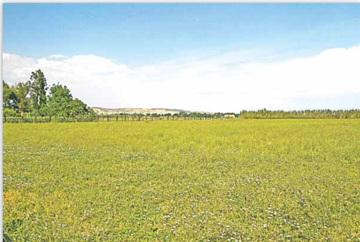
Aragón es la segunda Comunidad con mayor superficie calificada como rural

La importancia del medio rural, tanto en España como en Aragón, está fuera de toda duda. Las zonas rurales son un componente vital de la identidad y de la estructura física del territorio. Por ello, la Ley 45/2007, de 13 de diciembre, para el desarrollo sostenible del medio rural, (BOE de 14/12/2007), ha supuesto un gran hito, pues viene a establecer las bases de una política rural propia plenamente adaptada a las condiciones económicas, sociales y medioambientales particulares del medio rural español.