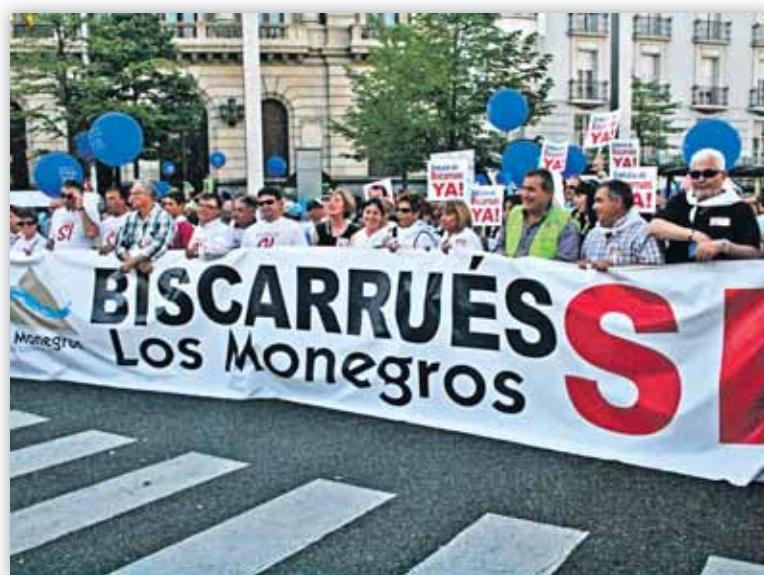
La Comarca de Los Monegros apoyó la protesta