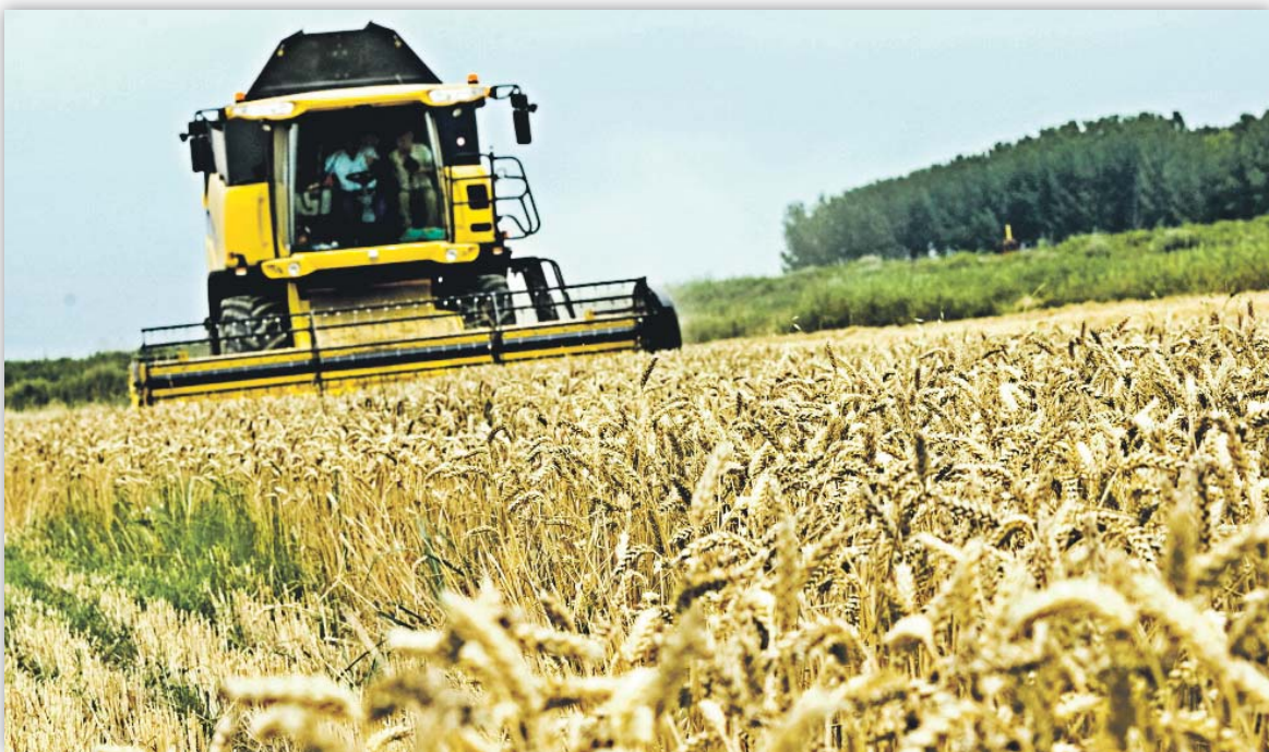
En las dos últimas campañas ha aumentado considerablemente el acondicionamiento de grano para siembra

En las dos últimas campañas se ha incrementado el acondicionamiento de grano para siembra debido a varios motivos. Algunos de ellos son la desaparición de la obligatoriedad de utilización de semilla certificada en las siembras de trigo duro para el cobro de las ayudas PAC y la necesidad del agricultor de abaratar los costes de producción.