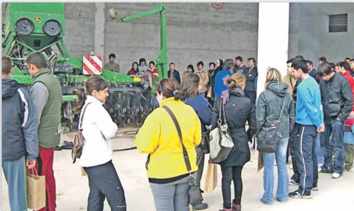
Los agricultores y ganaderos continúan acudiendo a las distintas actividades formativas programadas