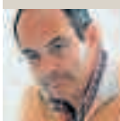
Director de Cooperativas Agro-alimentarias de Aragón