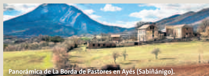
Panorámica de La Borda de Pastores en Ayés (Sabinánigo).

La Borda de Pastores está a un paso de las estaciones de esquí de Aramón Formigal y Aramón Panticosa y su ubicación la convierte en un alojamiento perfecto para los que quieren disfrutar de un día de esquí porque les permite desplazarse a pistas y volver a pernoctar en La Borda. Es sin duda un lugar tranquilo, diferente y tradicional pero con todas las comodidades para después de una intensa jornada invernal de esquí o de montaña.