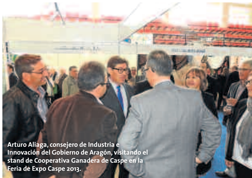
Arturo Aliaga, consejero de Industria e Innovación del Gobierno de Aragón, visitando el stand de Cooperativa Ganadera de Caspe en la Feria de Expo Caspe 2013.

que nos presta este emblemático edificio. Se trata de dar un servicio completo para el alojamiento de empresas/autónomos, facilitando el espacio físico adecuado de oficinas, servicios de recepción, administrativos, salas comunes de reuniones, formación e incluso la organización de eventos. ■