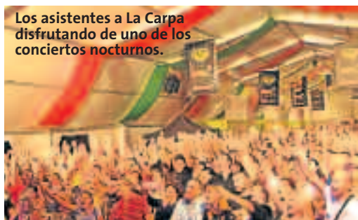
Los asistentes a La Carpa disfrutando de uno de los conciertos nocturnos.

Grupo Pastores ha querido agradecer su presencia a todos los asistentes, a la vez que pidió a aquellos que no han salido del todo satisfechos, para los que ya ha empezado a trabajar con el objetivo de seguir mejorando en 2014.