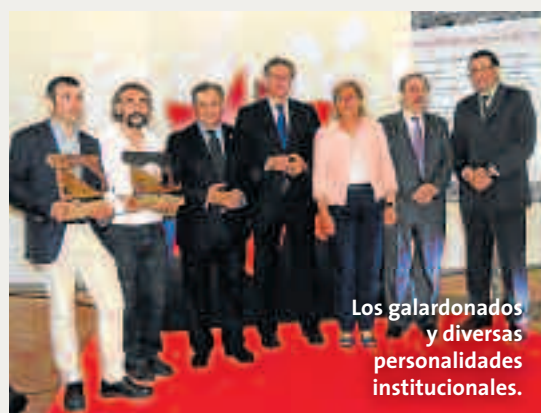
Los galardonados y diversas personalidades institucionales.

Excelente sabor, buena presencia y sugerente aroma. Estas son las principales cualidades de los jamones de Grupo Arcoiris y que han conquistado al jurado experto del Consejo Regulador del Jamón de Teruel que, tras una cata ciega en la que se presentaron 17 pernils de alta calidad Denominación de Origen, deter-