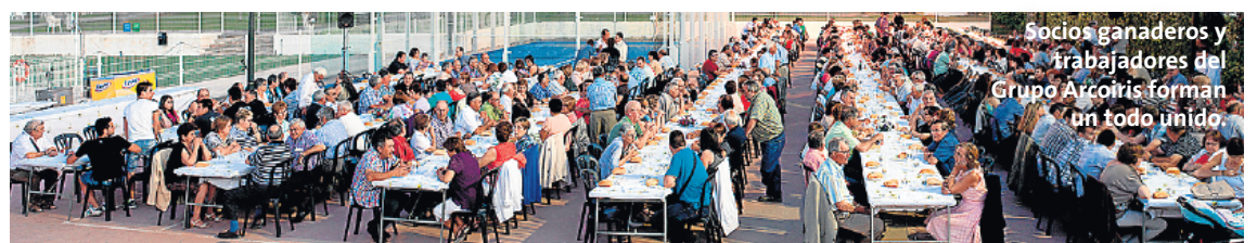
Socios ganaderos y trabajadores del Grupo Arcoiris forman un todo unido.

Grupo Arcoiris celebró el sábado 29 de junio su tradicional cena de convivencia a la que asistieron cerca de 600 personas, entre socios y trabajadores