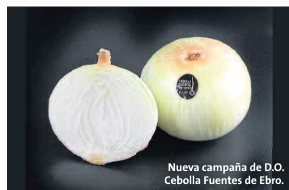
Nueva campaña de D.O. Cebolla Fuentes de Ebro.