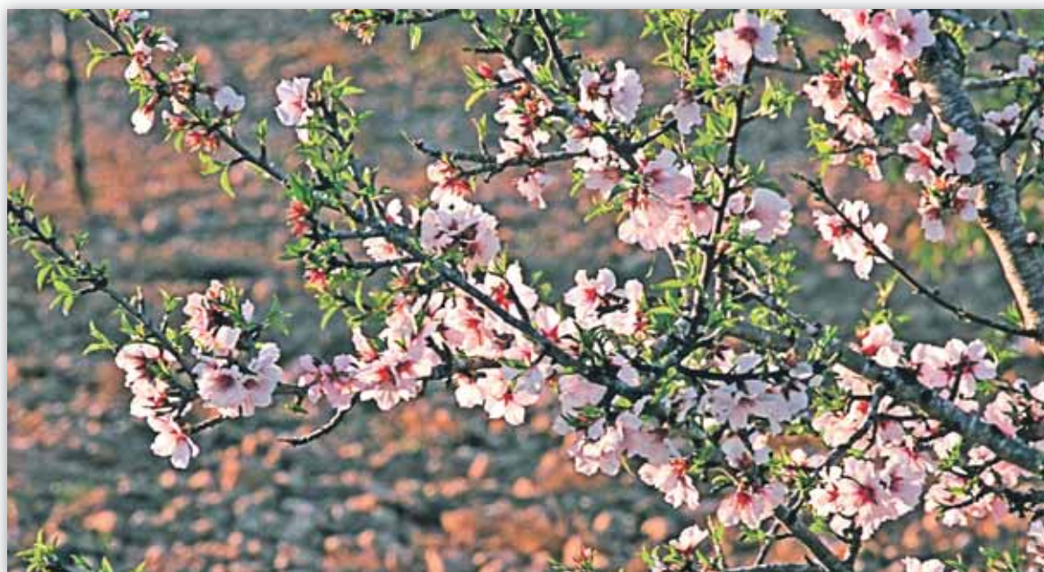
El sector de los frutos secos tiene capacidad para satisfacer la demanda mundial

a. Matarlas o capturarlas de forma intencionada, sea cual fuera el método empleado.