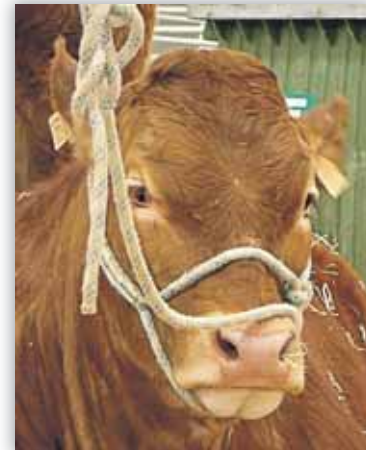
Los países ricos deberían reducir el consumo de carne

En primer lugar reduciendo las pérdidas en el proceso de consumo (que se han estimado en un