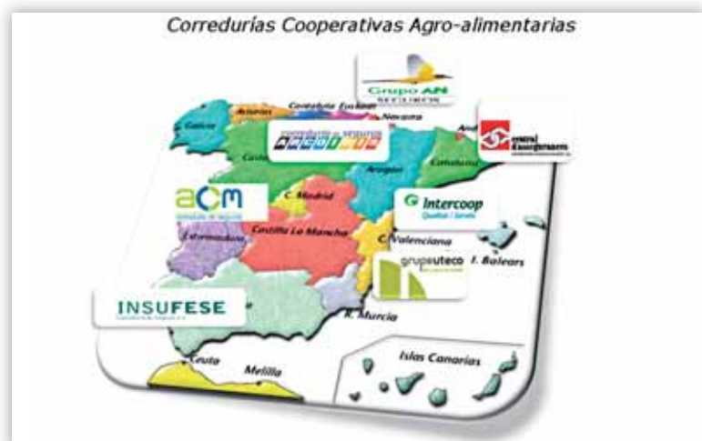
Mapa nacional de las corredurías vinculadas al proyecto de cooperativas