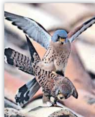
Pareja de cernícalos primilla.

OBLIGACIONES DEL SECTOR AGRARIO. Debemos tener en cuenta que estas obligaciones no afectan a aquellos cultivos herbáceos de porte alto con ciclo de verano (por ejemplo maizales), los cultivos leñosos y los hortícolas de regadío. En el caso de los tratamientos fitosanitarios y la aplicación de purines: en áreas críticas se da como periodo hábil para realizar los tratamientos el comprendido entre el 15 de agosto y el 15 de abril, entre el 15 de agosto y el 30 de junio en el caso de los dormitorios. En el