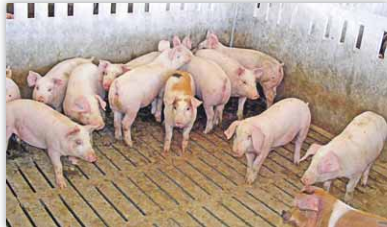
Se está trabajando para apoyar la exportación de producciones porcinas

Las cooperativas ganaderas y fabricantes de pienso están muy preocupadas por la continua e importante volatilidad de los precios de los cereales y las leguminosas en los últimos tiempos.