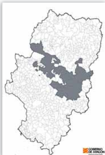
Ámbito de aplicación del Plan

El Departamento de Medio Ambiente del Gobierno de Aragón publicó en el BOA de 27 de diciembre de 2010 el Decreto 233/2010 en el que se aprueba el Plan de Conservación del Hábitat del Cernícalo Primilla. Desde Cooperativas Agro-alimentarias de Aragón se realizan alegaciones para la defensa de los intereses del sector agrario en la aplicación del mismo. Se trata de un halcón de pequeño tamaño, de unos 200 gramos, muy