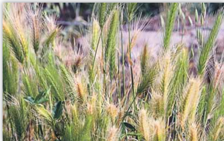
El aumento de precio de un alimento básico no se contrarresta fácilmente

♦ Departamento de Desarrollo Económico y Social de la Organización de las Naciones Unidas para la Agricultura y la Alimentación (FAO).