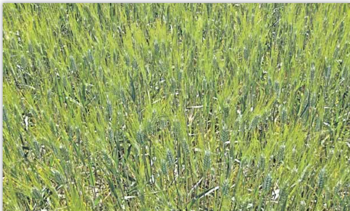
Como España, Aragón ha incrementado en esta campaña la producción de cereal