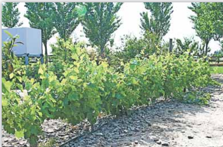
Hay que fomentar la diversidad alimentaria para reducir la vulnerabilidad

siendo ocasionada por un aumento aparente de los fenómenos meteorológicos extremos y por una mayor dependencia en zonas exportadoras nuevas donde las cosechas dependen de los caprichos del tiempo; una mayor dependencia en el comercio internacional para satisfacer las necesidades alimentarias, a costa de acumular existencias; una demanda creciente por productos alimentarios de otros sectores, especialmente del energético; y una mayor influencia de factores macroeconómicos, incluyendo la volatilidad de los tipos de cambio y modificaciones de las políticas monetarias. Es más, las empresas financieras están invirtiendo cada vez más en mercados derivados de productos básicos en su cartera de riesgos, ya que los beneficios de este sector parecen no estar relacionados con los de otros activos. Si bien generalmente no se considera a esta “financiarización de