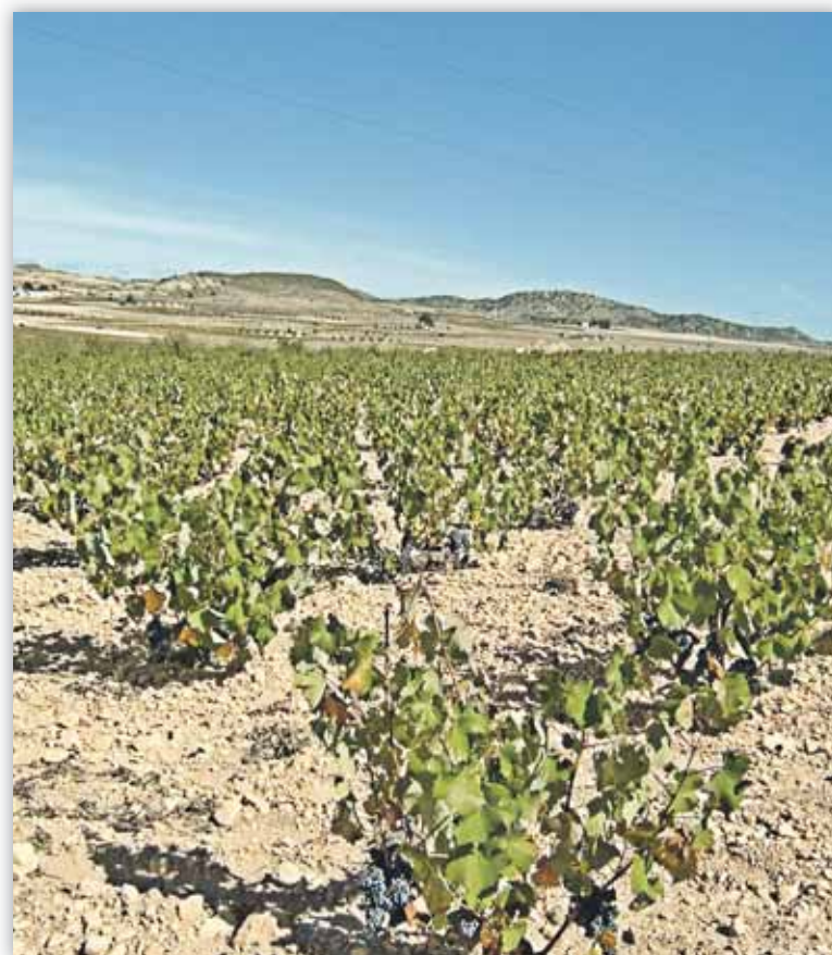
España posee una amplia superficie cultivada de uva de vinificación

Al acogerse a esta cobertura, todas estas Denominaciones de Origen podrán optar a un precio de aseguramiento superior, así como a una mejor cobertura frente al riesgo de pedrisco, ya que se adelanta el inicio de