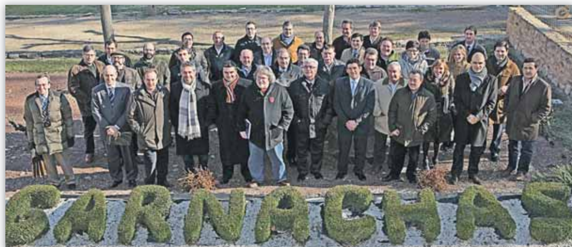
La visita tuvo lugar el pasado 24 de enero