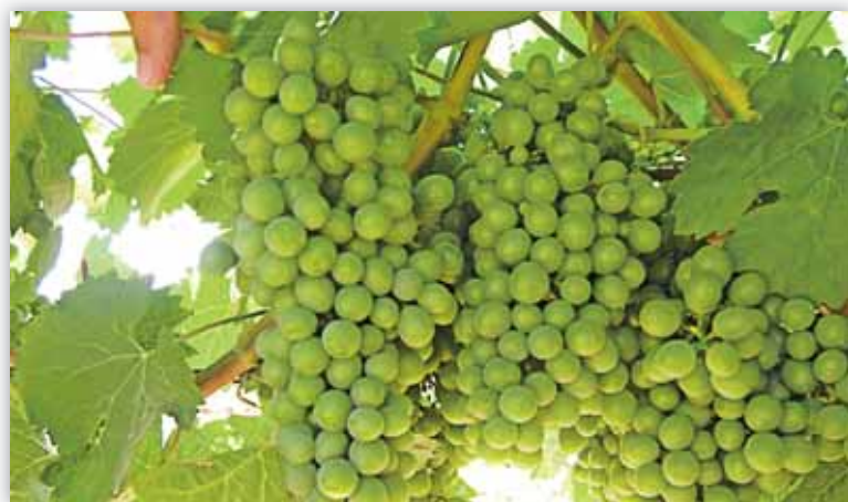
Los viticultores pueden proteger su cosecha mediante seguros