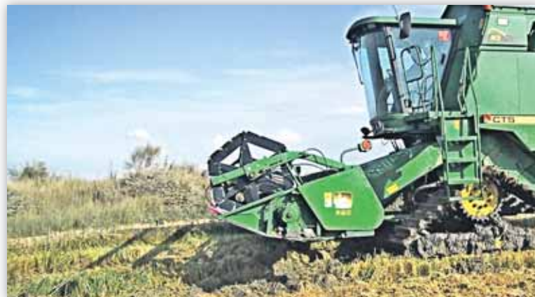
Algunos países han incrementado sus compras de arroz