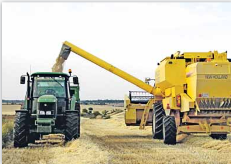
El modelo cooperativo aragonés quedó establecido en la Ley de 1998

Han transcurrido más de diez años desde la entrada en vigor de la Ley 9/1998, de 22 de diciembre, de Cooperativas de Aragón, primera Ley aragonesa que regulaba el cooperativismo, una década en la que el cooperativismo agrario ha sufrido profundas transformaciones derivadas de una mayor competencia y exigencia de eficacia en la gestión, así como de un mercado que cada día requiere más anticipación y recursos.