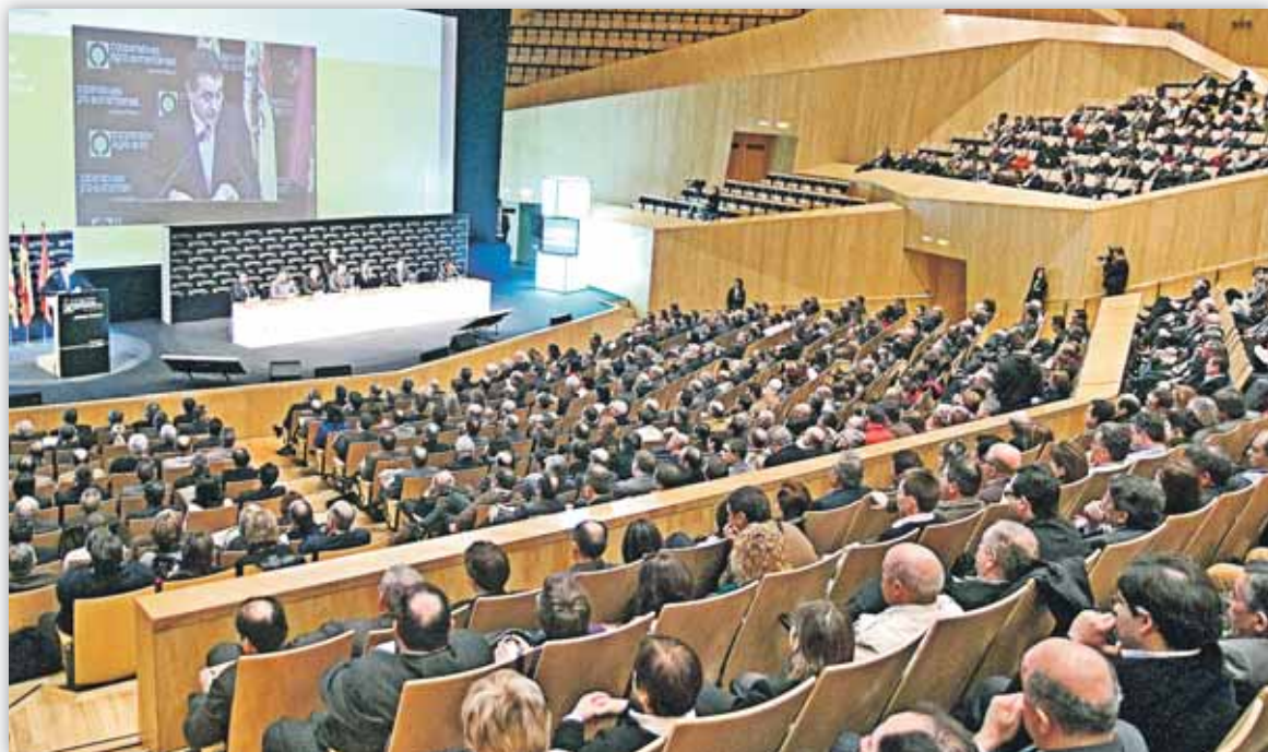
El VI Congreso de Cooperativas Agro-alimentarias llenó el Auditorio de Zaragoza