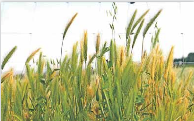
Durante 2009 el precio del cereal experimentó una gran caída

Los ingresos netos de las explotaciones cerealistas en la UE fueron de 214.000 euros, pero