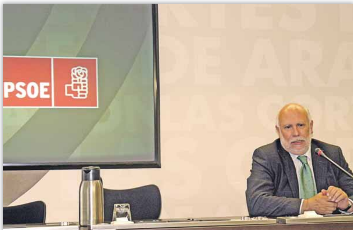
Franco considera que las cooperativas deben orientarse hacia el mercado para conseguir sus objetivos

“Desde Aragón, pretendemos mantener y reforzar los lazos de cooperación existentes con el sector”