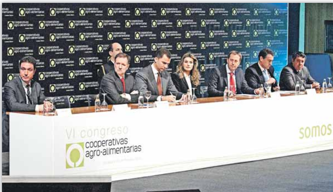
Los Príncipes de Asturias presidieron la inauguración del VI Congreso de Cooperativas Agro-alimentarias

valientes de lo que somos nosotros. Hemos construido una buena base y eso es bueno, pero nos da una falsa seguridad y eso es malo. No podemos vivir profesional y empresarialmente con miedo permanente a perder lo que se tiene, pensando en que si seguimos haciendo las cosas como se han hecho siempre, no nos pasará nada, pues nada cambiará. Hoy, todos somos conscientes: cambia la realidad a cada momento y a veces tan rápido que llamamos actualidad a lo que acaba de pasar y no a lo que está sucediendo, y es por eso que debemos forzar la máquina para ir, por lo menos, a la misma velocidad que la corriente que