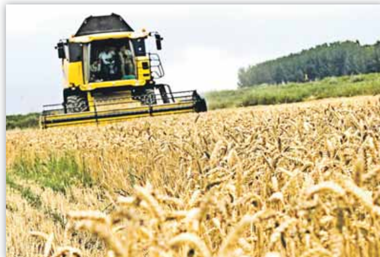
Los agricultores dependen mayoritariamente de los productos básicos

LA COHERENCIA Y LA COORDINACIÓN SON CLAVE. Las intervenciones políticas en episodios pasados de volatilidad extrema han fallado frecuentemente, debido a que las restricciones presupuestarias y el incremento de los precios fueron de tal magnitud que imposibilitaron estabili-