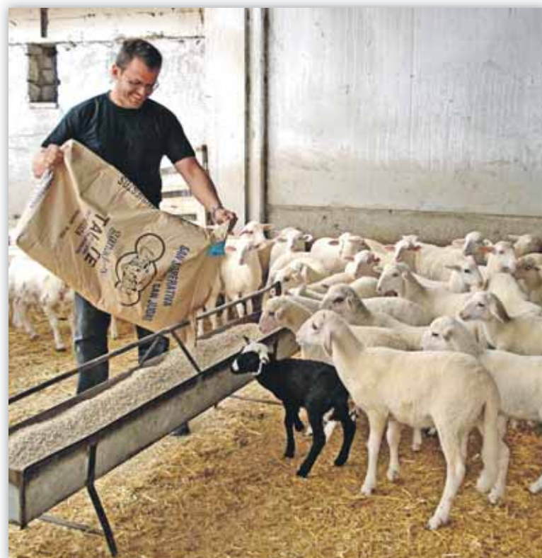
El precio de los piensos está sometido al mercado del cereal

se convierte en el importe de salida para que los puertos realicen su oferta y a la vez, éste se convierte en un precio de referencia para que los proveedores españoles hagan su propuesta, convirtiendo la regla comercial "si hay poco es caro y si hay mucho es barato" en una pura anécdota. De esta manera, en el último año, la cebada ha subido de 125 a 229 euros/tn, el maíz de 143 a 240 y el trigo de 140 a 243... Increíble. Ya hace tiempo que comprobamos que este mercado sujeto a tanta incertidumbre no permite elaborar con exactitud planes de compra a largo plazo y que el miedo a los cambios constantes del sector exigen realizar compras a corto plazo. Esta situación, muchas veces "sin sentido", es la pescadilla que se muerde la cola: nosotros hemos cambiado la frecuencia y compramos más a corto plazo. Ante esto, el proveedor