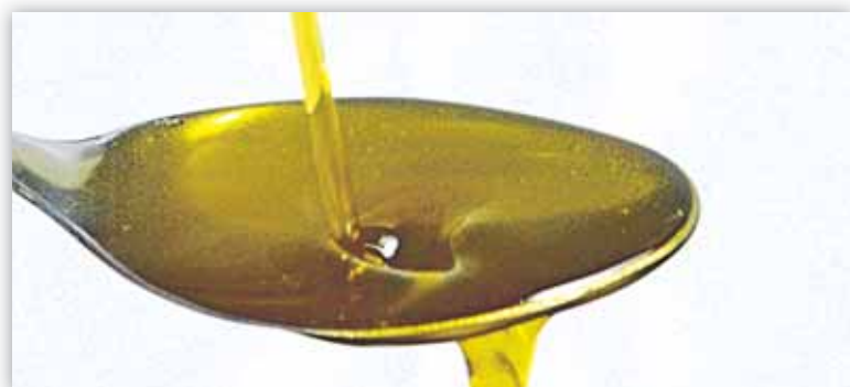
Las dos D.O. aragonesas utilizan la Empeltre como base de su aceite

♦ Belén López, Cooperativas Agro-alimentarias Aragón