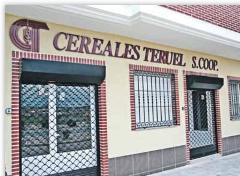
Tras la inauguración de su sede en Calamocha, Cereales Teruel sigue creciendo.

los socios y rectores de ambas entidades por la iniciativa y generosidad demostrada en el proceso. Esta fusión redundará sin duda en beneficio de los socios de la entidad resultante. •