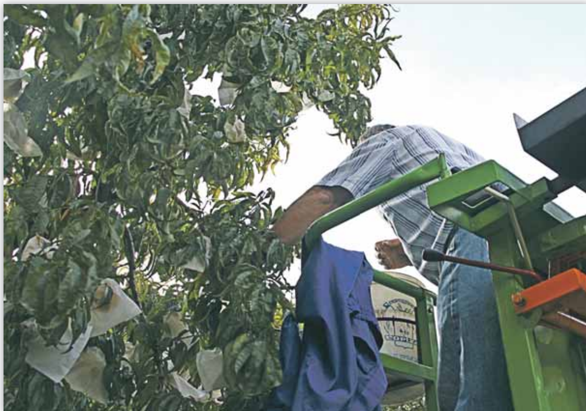
El aumento de las concesiones comerciales en frutas es gravemente lesivo para el sector de la UE

Por ello, agricultores españoles, franceses e italianos consideran imprescindible potenciar y co-