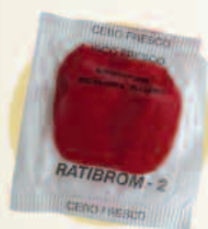
Cebo fresco 10 g

ALTA APETENCIA + TOTAL EFICACIA = CONTROL 100%