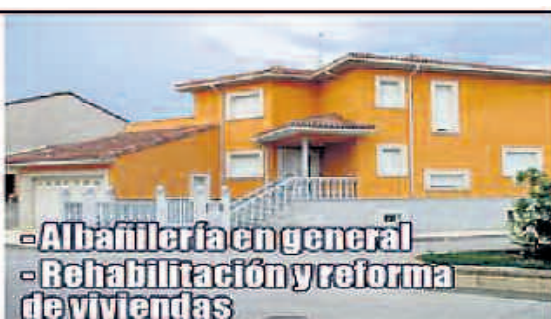
- Albañilería en general - Rehabilitación y reforma de viviendas

Polígono Valdeferrín, parc. R-132-133 50600 EJE DE LOS CABALLEROS (Zaragoza) Teléfonos: 976 66 02 09 - 676 47 25 89 Fax: 976 66 42 16 admon@ccbernardo.com www.ccbernardo.com