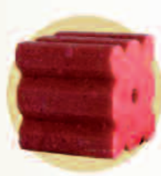
Bloque estriado 20 g