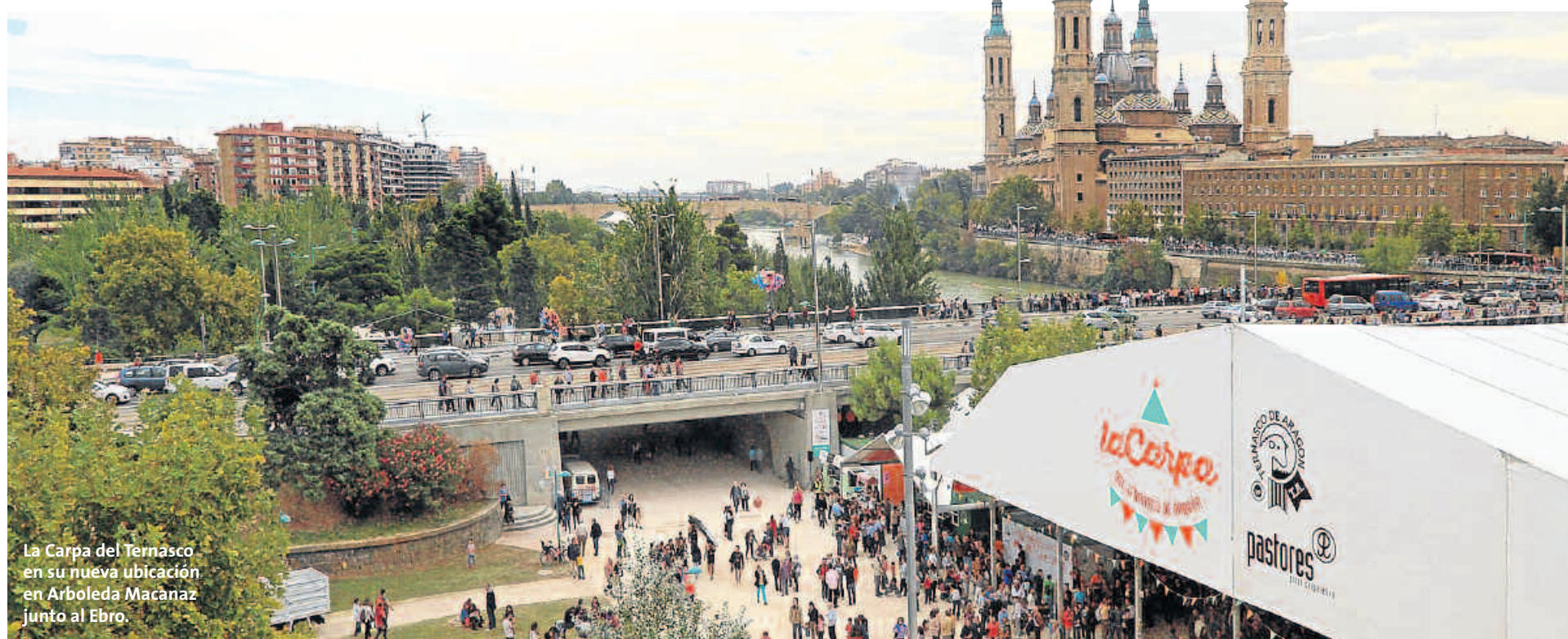
La Carpa del Ternasco en su nueva ubicación en Arboleda Macanaz junto al Ebro.