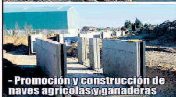
- Promoción y construcción de naves agrícolas y ganaderas