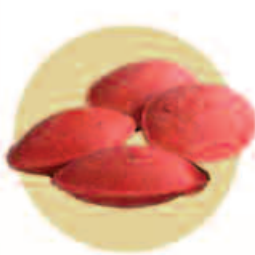
Óvulo 4/5 g