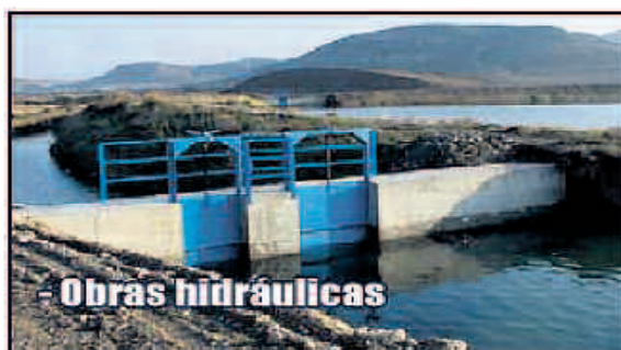
- Obras hidráulicas

Ante la posibilidad de verse afectado por la sequía, el pedrisco u otro tipo de fenómenos imprevistos e incontrolables, el Seguro para Explotaciones de Cultivos Herbáceos Extensivos se perfila como una herramienta eficaz para salvaguardarse ante la incertidumbre. ■